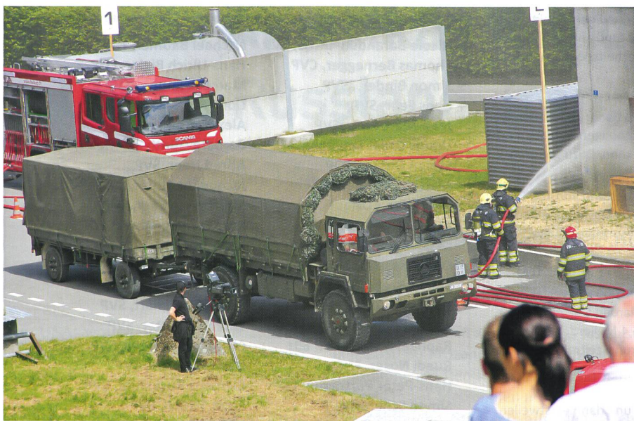
Die Armee eilt zu Hilfe: Auf dem Schadenplatz trifft ein Rettungszug ein.