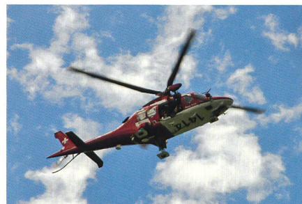
Der REGA-Heli bringt einen Notarzt.