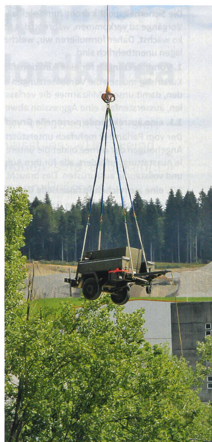
Materialtransport aus der Luft.