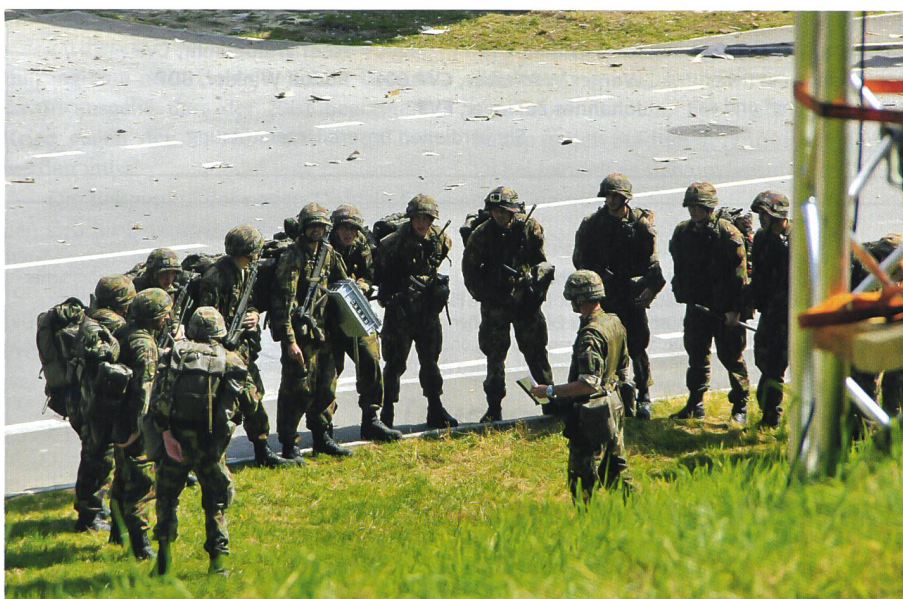
Sofort hat der Zugführer die Lage erfasst: Befehlsausgabe auf dem Schadenplatz.