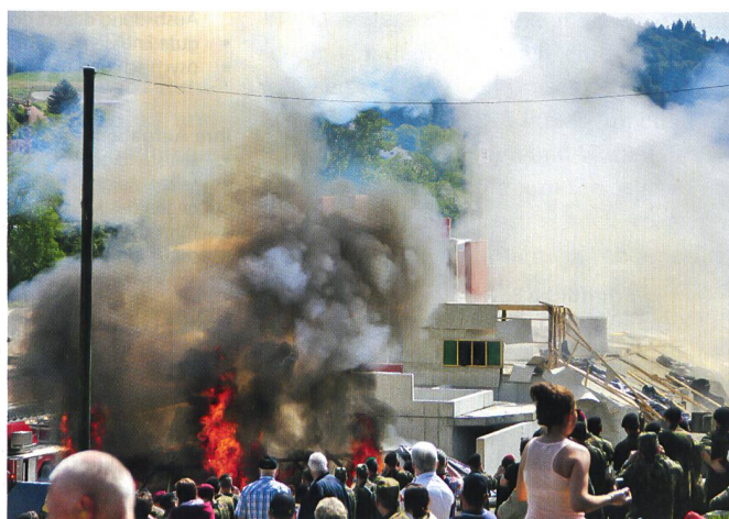
Material fliegt durch die Luft. Es raucht und stinkt.