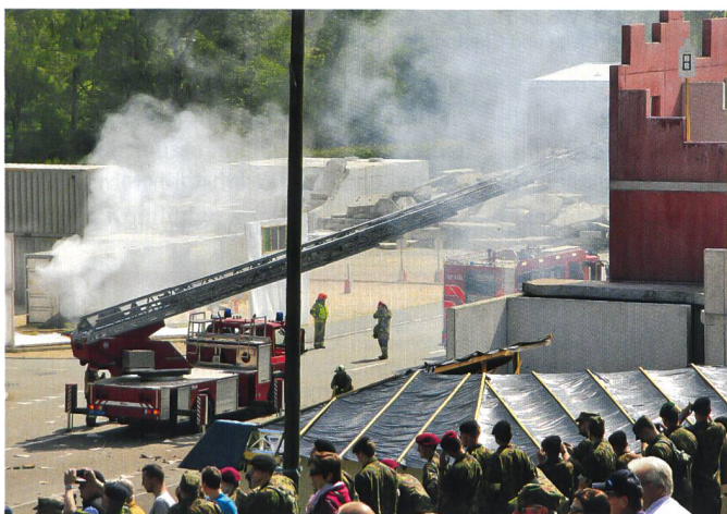
Die zivile Komponente: Die Feuerwehr im Grosseinsatz.