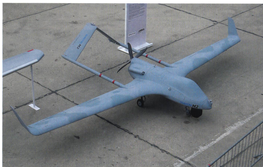
Drohnen in allen Grössen mit unterschiedlichsten Aufgaben wurden von vielen Herstellern präsentiert. Hier eine Kleindrohne aus dem Airbus-Konzern.

rigen Modells gemeinsam mit den potenziellen Kunden geprüft, um den Nutzen der X6 für ihre Einsätze zu bestätigen oder zu korrigieren.