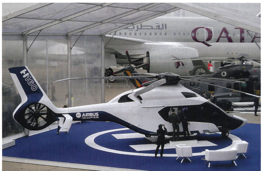
Die Zukunft: Der neue Airbus-Helikopter H160, gebaut mit neuen, innovativen Technologien. Markant: Die gebogenen Rotorblätter.

Es überrascht deshalb nicht, dass der Mischkonzern United Technologies plant, seine Tochter Sikorsky mangels Rendite zu