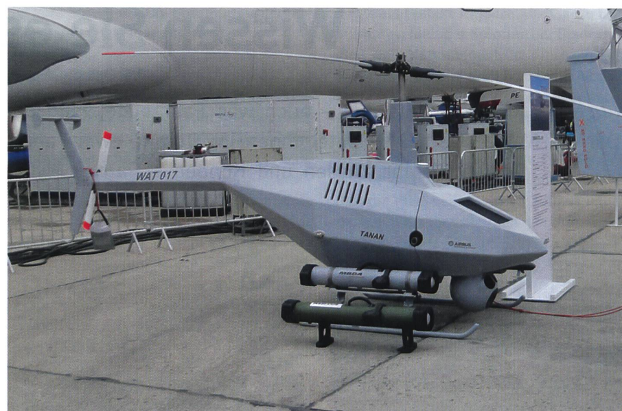
Auch Helikopter als Drohnen mit Aufklärungs- und Waffensystemen waren zu sehen.

In der nun folgenden Phase werden die mögliche Vermarktung, die Architektur und die Konstruktion des neuen zweimotorigen Modells gemeinsam mit den potenziellen Kunden geprüft, um den Nutzen der X6 für ihre Einsätze zu bestätigen oder zu korrigieren.