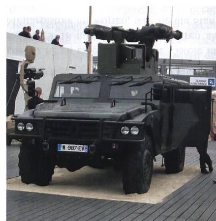
MBDA zeigte ein Fliegerabwehrsystem auf einem geländegängigen Fahrzeug.

Der CEO von Airbus Helicopters, Guillaume Faury, will «die effizientesten Helikopterlösungen auf den Markt bringen, Lösungen, die darauf abgestimmt sind, wie sich die Anforderungen unserer Kunden und die Branche entwickeln.»