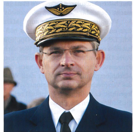
General Mercier, Kommandant der Luftwaffe. Kampfpilot mit 3000 Flugstunden.