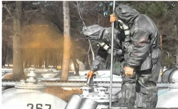
Die Arbeit in der Nähe der Tanks mit Melange ist nur noch in Schutzanzügen möglich.