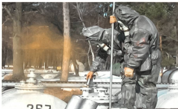
Die Arbeit in der Nähe der Tanks mit Melange ist nur noch in Schutzanzügen möglich.