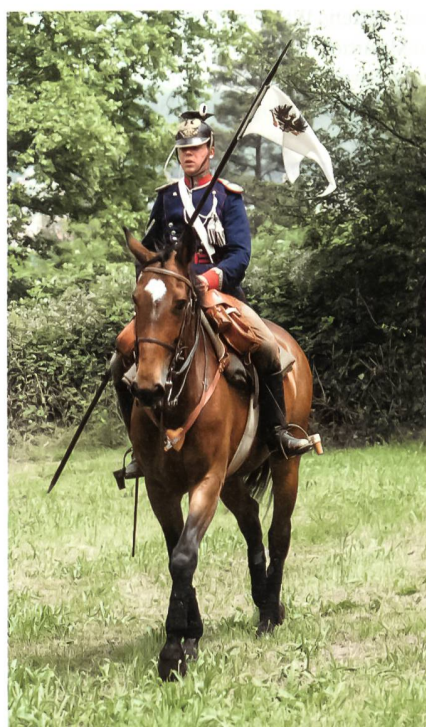
Hoch zu Ross in den Kampf.