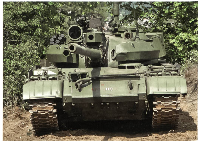
Vorführung des ehemaligen WAPA-Panzers T-55.