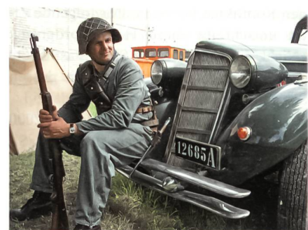
Erinnert an den früheren Militäralltag.