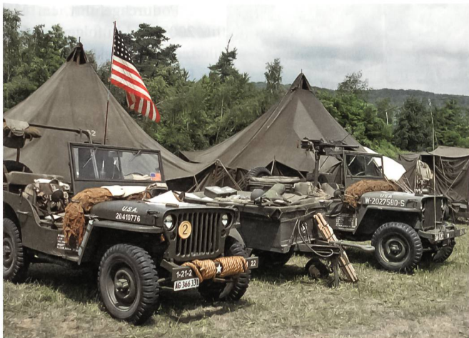
Jeeps im Feldlager.