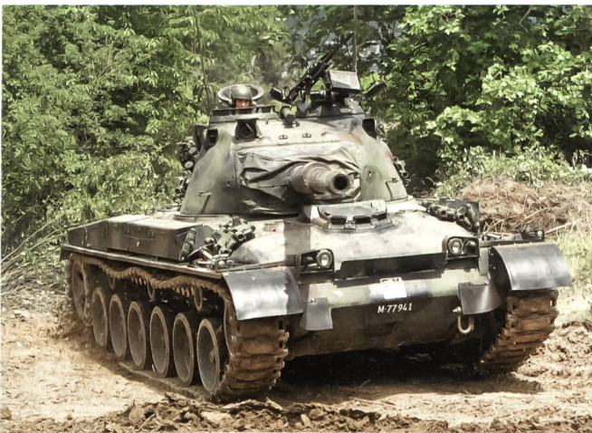
Der Panzer 68 zeigte eine Demonstration auf der Geländepiste.