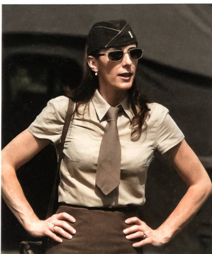
In amerikanischer Uniform.