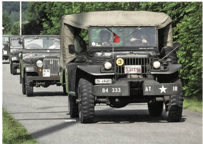
Ein wahres Vergnügen – die Ausfahrt mit Dodge und Jeep.