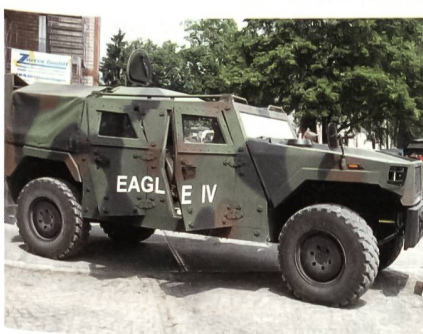
Der moderne Eagle IV.