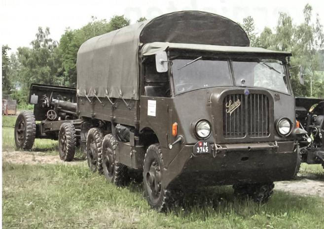
Saurer-Zugfahrzeug mit angehängtem Geschütz.