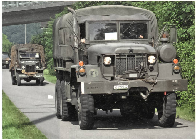
Die schönen, gepflegten amerikanischen Oldies auf dem Corso.