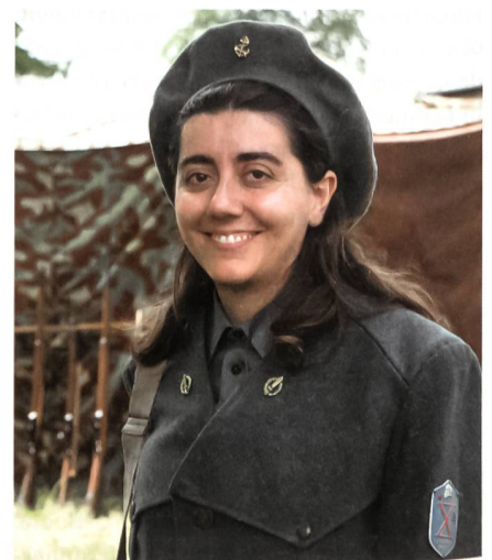
Aus Italien angegeist.