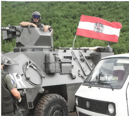
Strassensperre oben auf dem Pass.