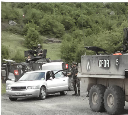
Ein Verdächtiger wird angehalten.