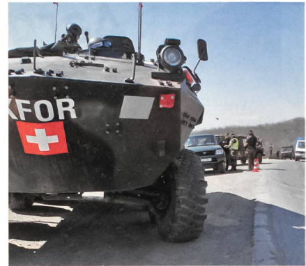
Schweizer Präsenz unten am Pass.