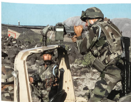
Schiessausbildung mit dem alten 7,62-mm-Maschinengewehr in der Steinwüste Afrikas. Die harte Ausbildung hört in der Legion niemals auf. Fünf Jahre ist die Mindest-Verpflichtungszeit.

Doch was ist übriggeblieben von den langen, zerlumpte Marschkolonnen freiwilliger Ausländer, die noch in Nordafrika und Indochina für französische Interessen bereitwillig krepiereten? Nach vielen Umstrukturierungen, Reformen, Auflösungen und Neuaufstellungen gliedert sich die französische Fremdenlegion heute in neun Fremdenregimenter und zwei kleinere Abteilungen, die teilweise weltweit verstreut sind. Die Regimenter haben unterschiedliche Grössen und Ausrüstung und