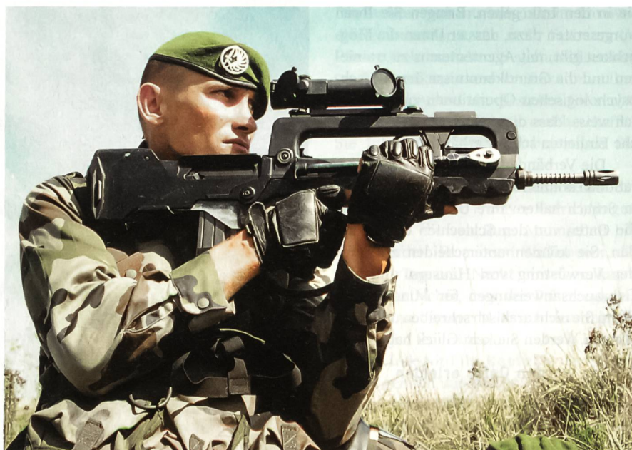
Fallschirmjäger des 2. REP mit dem Bullpup-Sturmgewehr FAMAS in 5,56 mm x 45. Die Waffe verfügt über ein Zweibein, und nachträglich wurde ein Zielfernrohr angebracht.

Ihr erster Kommandant, der Schweizer Oberst Baron Christoph Anton Jakob Stoffel aus Arbon, führte diese harte Truppe