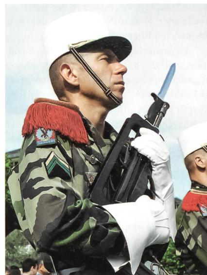
Legio Patria Nostra: Die Legion ist unsere Heimat, so das Credo der Elitetruppe. Hier ein stolzer Legionär des elitären 2. REP bei einer Parade.

«Ich habe es in Deutschland nicht mehr ausgehalten, mir ist die Decke dort auf den Kopf gefallen», so seine Begründung. Ein anderer, erst seit ein paar Monaten in der Steinwüste, erklärt: «Ich war vorher bei den Fernspähern der Bundeswehr, aber ich wollte in den Kampfeinsatz.» Das kann er hier natürlich haben, so auch die klare Aussage der Legionsführung vor Ort. Bei einer anderen Möglichkeit stösst der Autor in Europa auf die Fallschirmjäger des 2. REP (Régiment Etrangère de Parachutistes). 1160 Legionäre sind in Calvi auf der Insel Korsika stationiert. Im Camp Raffalli trainieren die Legionsfallschirmjäger für riskante Commandounternehmen und sind die Speerspitze der französischen Streitkräfte.