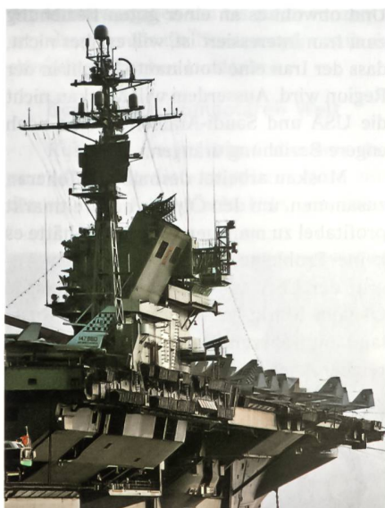
Vor dem Hafen von Barcelona liegt die CV 67 vor Anker.

7. September 1968 wurde der neueste Flugzeugträger unter dem Kommando von Kapitän zur See Earl Yates offiziell in den Dienst der US Navy gestellt.