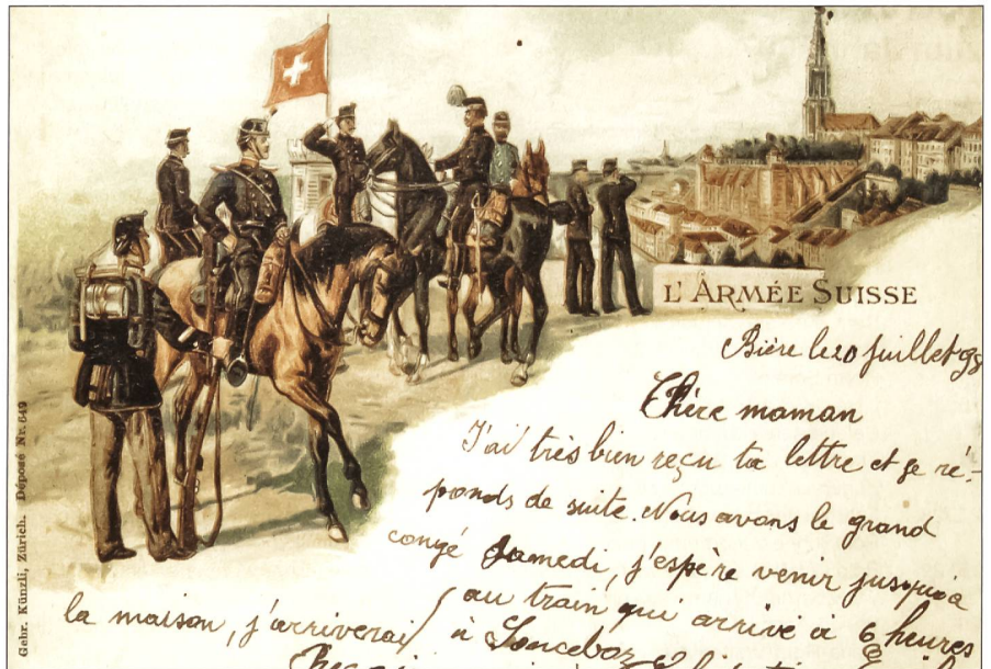
Grüsse aus dem Soldatenleben.

Am Wiener Kongress von 1815 wurde die Schweiz als unabhängiger Staat anerkannt und dazu verpflichtet, die Neutralität nötigenfalls mit Waffengewalt zu verteidigen.