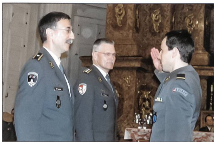
Der Akt der Beförderung.