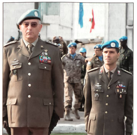
Generalmajor Claudio Graziano aus Italien.

In einer seiner letzten Verwendungen führte Graziano von Juli 2005 bis Februar 2006 die multinationale Brigade in Kabul, die ein Teil der von