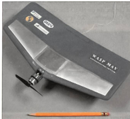
Wasp Micro Air Vehicle.

ASSIST (Advanced Soldier Sensor Information System and Technology), ein fortschrittliches Soldaten-Sensor-Informationssystem und -Technologie, ist ein anderes Werkzeug, das spezielle