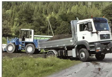
Beim abgebildeten Lastwagen handelt es sich um den MAN TGA 18.430 4x4 mit Drei-Seiten-Kipper, wie er von Schweizer Kunden eingesetzt wird.

Die Bundeswehr hat bei der MAN 500 Lastwagen des Typs TGA 18.360 4x4 BB bestellt. Die Fahrzeuge haben eine Nutzlast von fünf Tonnen und erfüllen besondere Anforderungen an einen verwindungsarmen Pritschenaufbau.