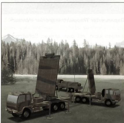
Die Darstellung zeigt das neu zu entwickelnde Feuerleitradar des mobilen Luftverteidigungssystems MEADS, das gemeinsam von Deutschland, Italien und den USA unterstützt wird. Mit der Lieferung der ersten Prototypen wird zwischen 2012 und 2014 gerechnet.

Der Bereich Defence & Security Systems der EADS wurde mit der Lieferung von modernsten Elektronikkomponenten für das trinationale MEADS-Programm (Medium Extended Air Defence System) beauftragt. Sie sollen das Feuerleitradar des Systems zum leistungsfähigsten Radar machen. Wie das Unternehmen mitteilt,