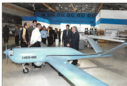
Taktisches UAV I-View-250.

Dieses UAV hat eine Flügelspannweite von 6,7 Metern und verfügt über ein vollautomatisches Start- und Landesystem. Mit seinem Katapultstarter kann es sogar von unebenen Flächen, die kleiner als ein Fussballfeld sind, starten. Das