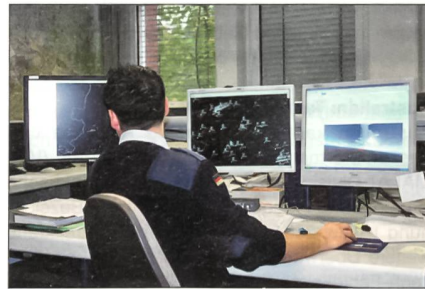
Arbeitsplatz in der Flugüberwachung.

Eurocontrol – eigentlich European Organisation for the Safety of Air Navigation – wurde 1963 gegründet und hat Mitglieder aus derzeit 37