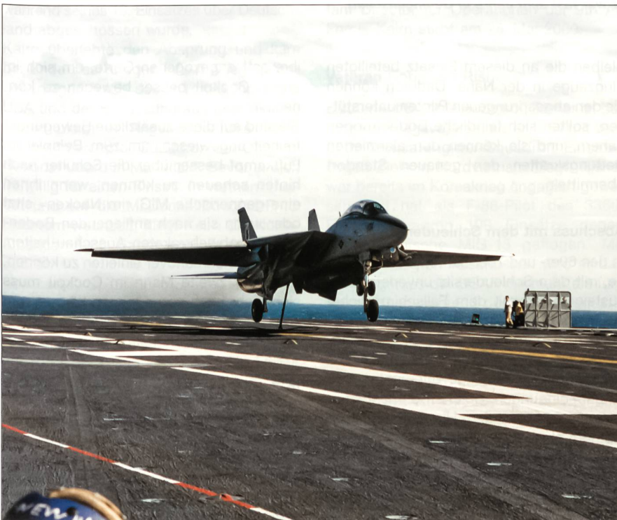
Eine F-14 der Fighter-Squadron VF-41 greift ein Fangseil bei der Landung auf der USS Theodore Roosevelt (CVN-71) vor der Küste Virginias anlässlich von Flugoperationen im Oktober 1995.