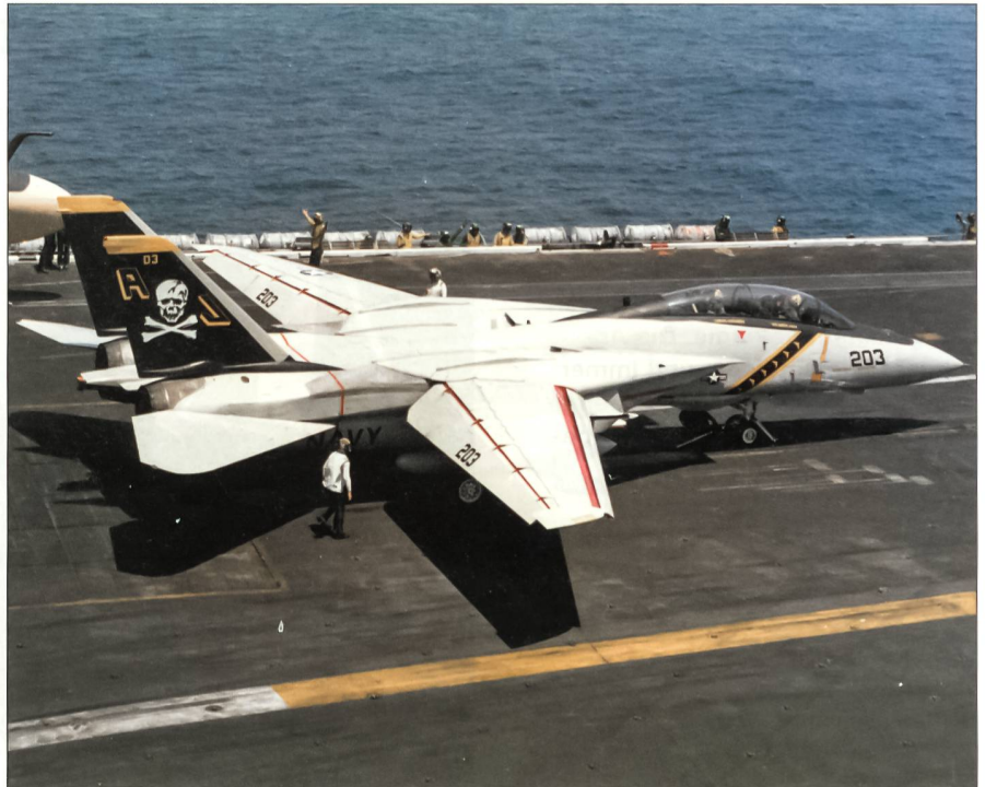
Eine F-14A der Fighter-Squadron 84 wird zum Katapultstart vom Flugzeugträger USS Nimitz (CVN 68) vor der Küste Virginias vorbereitet. Links hinten ist eine KA-6D Intruder-Betankungsmaschine erkennbar.

Diese 22 Maschinen F-14D der Fighter-Squadron 31 (Tomcatters) und der Fighter-Squadron 213 (Blacklions) wurden dann am 10. März 2006, einen Tag bevor der Träger nach Norfolk zurückkehrte, von Bord katapultiert; die letzte F-14 mit der Kennziffer 112 gehörte der VF-31 an. Der Kommandant des Marineflieger-Geschwaders 8, Kapitän zur See Bill Sizemore, hatte es sich nicht nehmen lassen, an diesem Tage selber auch noch eine der Maschinen zu