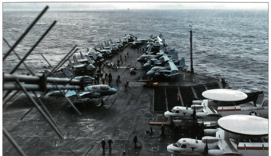
Im November 1987 kreuzte die USS Enterprise anlässlich von grossen Seemanövern der 3. US-Flotte in der Beringsee, unweit der Inselkette der Aleuten. Wechselhaftes kaltes Wetter und teils hoher Seegang stellten höchste Ansprüche an fliegende Besatzungen und die Mannschaft des Trägers. Auf dem Vordeck der Big E sind A-7E-Corsair-II- und A-6E-Intruder-Jagdbomber, EA-6B-Prowler-Elektronik-Flugzeuge und E-2C-Hawkeye-Radarfrühwarnflugzeuge zu erkennen.