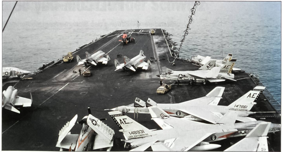
Ende März 1964 besuchte die brandneue USS Enterprise Cannes an der französischen Riviera. Der Autor konnte die Big E dort zum zweiten Mal besuchen. An Bord waren damals gegen 100 Flugzeuge, darunter die Fighter Squadron 102 mit F-4B Phantom II und die Fighter Squadron VF-33 mit F-8E-Crusader-Jagdflugzeugen, die Attack Squadron VA-65 mit A-1H-Skyraider-Propeller-Kampfflugzeugen und die Heavy Attack Squadron VAH-7 mit A-5A-Vigilante-Nuklearbomben. Diese Maschinen sind hier auf dem Vordeck der USS Enterprise erkennbar. Zum Bestand gehörten ferner auch einige Detachements und drei A-4C-Skyhawk-Staffeln. Knapp zwei Jahre später stand die Big E vor Vietnam im Einsatz.

Ihr heutiges Marineflieger-Geschwader 1 zählt drei F/A-18-C/D-Hornet-Staffeln,