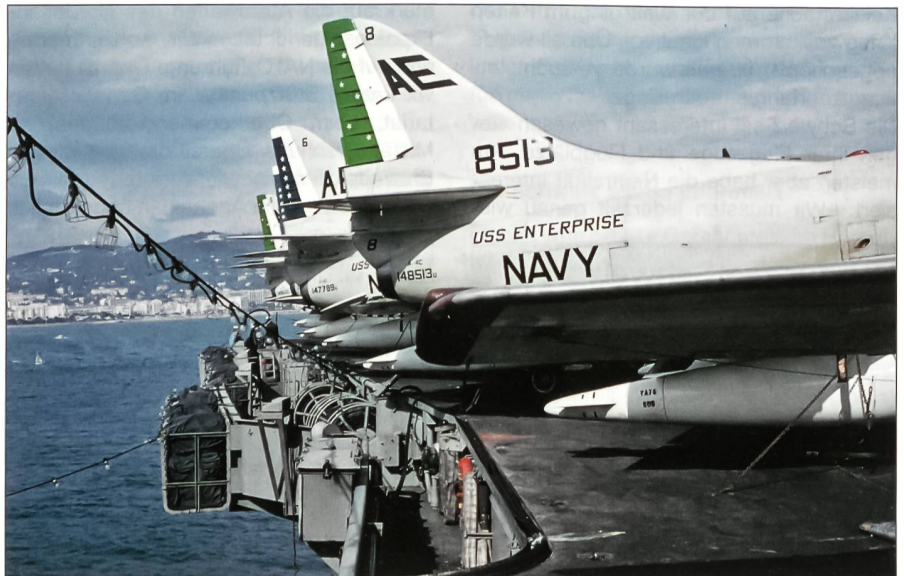
In den 60er-Jahren führte die USS Enterprise drei Staffeln A-4C-Skyhawk-Jagdbomber mit. Hier sind Maschinen von zwei Staffeln (vorne eine A-4C der Attack Squadron VA-76 und hinten solche der Attack Squadron VA-66) auf dem Achterdeck des Trägers parkiert. Im Hintergrund Cannes.

1965 wechselte die USS Enterprise ihren Heimatstützpunkt von Norfolk in den Pazifik. In den Jahren 1965 bis 1972 fuhr sie sechs Mal für jeweils viele Monate in die Gewässer vor Vietnam; erstmals flogen ihre