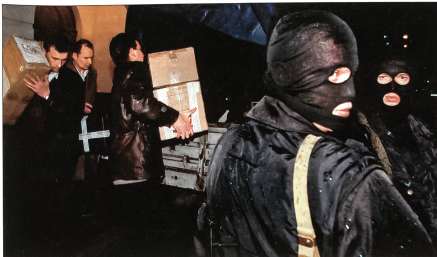
Anti-Terror-Einheit bei Hausdurchsuchung.

Russische Föderation: Fläche: 17 075 400 km 2 , Einwohner (2003): 143 425 000; Bevölkerung: 79,82% Russen, 3,83% Tataren, 2,03% Ukrainer, 1,15% Baschkiren, 1,13% Tschuwaschen, 0,94% Tschetschenen, 0,78% Armenier, 0,58% Mordwinen, 0,56% Weissrussen, 0,41% Deutsche, 8,77% Sonstige; Religion (2002): etwa 75 Mio. Russ.-Orthodoxe, 19 bis 22 Mio. Muslime, zirka 800 000 Katholiken, 230 000 Juden.