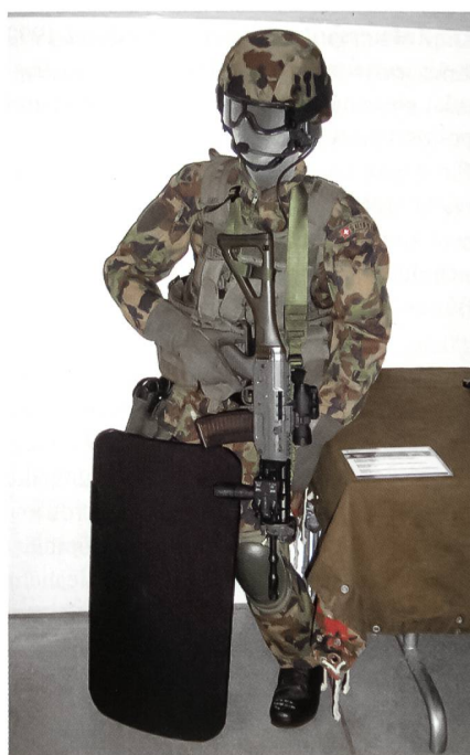
... und zu Lande.