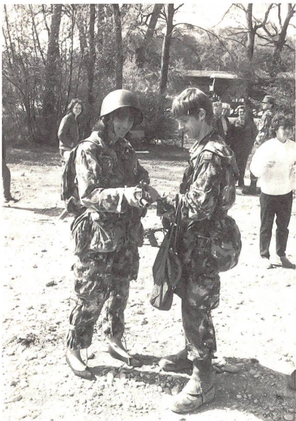
Er hat seinen Schatz in den «Kämpfer» gesteckt und bringt ihm grad noch die soldatisch richtige Handhabung des Sturmgewehres bei.