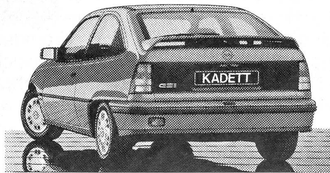
Kadett GSi: Hochwertige Technik geprägt von Ihren Wünschen.

Mit einer Technik, die vom eng abgestuften 5-Gang-Sportgetriebe, bis hin zur Sportaufhängung reinstes Fahrvergnügen vermittelt. Ohne Abstriche an Sicherheit und Wirtschaftlichkeit.