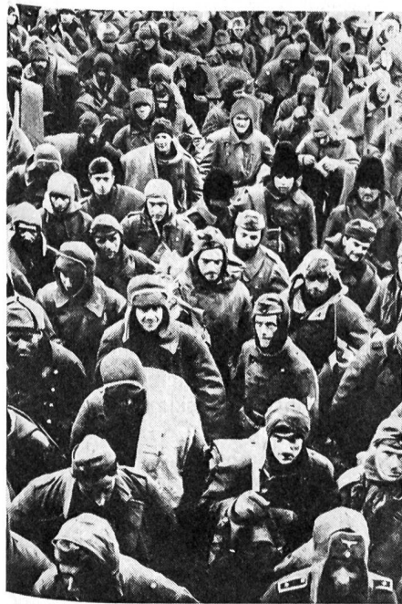
Eine Kolonne Stalingradgefangener, bestehend aus deutschen und rumänischen Soldaten

Nichts dergleichen geschah. Hitlers Reaktion auf die Stalingrader Kapitulation war ein Wutausbruch. Er beschuldigte Paulus der Feigheit, dass er nicht die Kraft hatte, sich zu erschiessen. «Im Deutschen Reich haben im Frieden jährlich 18 000 bis 20 000 Menschen den Freitod gewählt, ohne irgendwie in einer solchen Lage zu sein. Hier kann ein Mensch sehen, wie 45 000 bis 60 000 seiner Soldaten sterben und mit Tapferkeit bis zum letzten sich verteidigen — kann er sich da den Bolschewiken ergeben? Ach, das ist...!» Und am Ende: «In diesem Krieg wird niemand mehr Feldmarschall!»