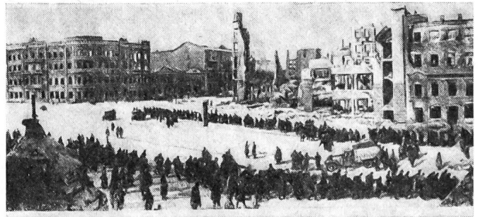
Der Rote Platz in Stalingrad, wo in einer Warenhausruine das letzte Hauptquartier des AOK 6 war (Februar 1943)

«Am 24. Januar wurde ich zum Stab Paulus gerufen. ... Ich wurde wie ein vornehmer Herzog empfangen. Man bot mir Zigaretten, Kaffee, französischen Kognak usw. an. Aus den weiteren Gesprächen wurde klar, dass wir gemäss Führerbefehl bis zur letzten Möglichkeit kämpfen sollten, dass es aber auch wünschenswert wäre, die Person des Oberbefehlshabers und sein nächstes Gefolge aus dem Nahkampf herauszuhalten. Das heisst, noch während des Kampfes sollte ich Verhandlungen über ihre Sicherheit führen. General Schmidt begriff natürlich die offensichtliche Unmöglichkeit eines derartigen Vorgehens. Er erklärte mir, dass ich im geeigneten Moment nach eigenem Ermessen handeln müsse. ... General Paulus sprach sowohl damals als auch später ständig davon, dass er sich unbedingt erschiessen müsse. Seine nächste Umgebung und ich überzeugten ihn davon, dass er dazu nicht