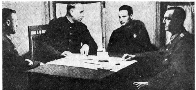
Das erste Verhör des Generalfeldmarschalls. Am Tisch in der Mitte: General Paulus. Am Tisch rechts: General Sumilov.