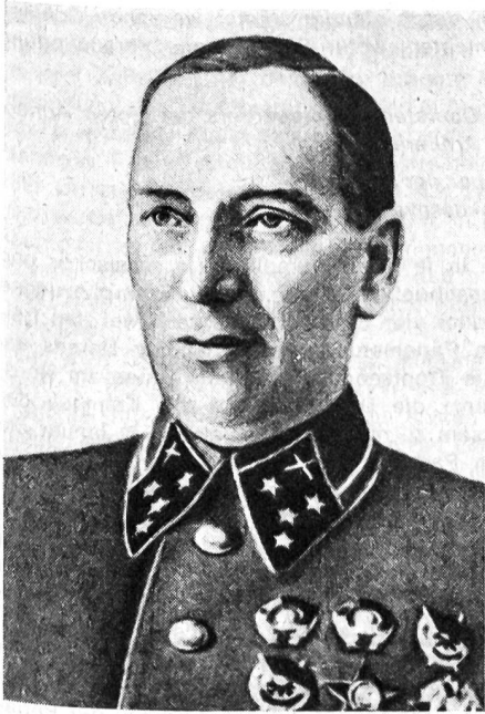
Generaloberst der Artillerie N. N. Voronov, Vertreter des Obersten Hauptquartiers der Roten Armee bei der «Donfront» (Heeresgruppe)

in die Hand zu bekommen. Inzwischen wurden als Flankendeckung links und rechts der 6. Armee die 4. und die 3. rumänische Armee eingeschoben. Was deren Kampfkraft betraf, waren sie äusserst unvollkommen ausgerüstet. So fehlten ihnen die schweren und panzerbrechenden Waffen.