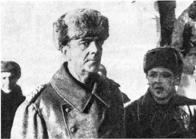
Generalfeldmarschall Friedrich Paulus in russischer Gefangenschaft (1. Februar 1943)

wusste wohl, was Hitler von ihm «als letzte Pflichterfüllung» verlangte. Er konnte sich jedoch zu einem Selbstmord nicht entscheiden. Noch am selben Tag liess Paulus zwei Funkprüche an Hitler entsenden, in denen er seinem obersten Befehlshaber ein weiteres Ausharren in Stalingrad («bis zum letzten Mann und bis zur letzten Patrone») versicherte und seinen Glückwunsch zum Jahrestag der Machtergreifung aussprach («Noch weht die Hakenkreuzfahne über Stalingrad. Unser Kampf möge den lebenden und kommenden Generationen ein Beispiel dafür sein, auch in der Hoffnungslosigkeit nie zu kapitulieren!»).