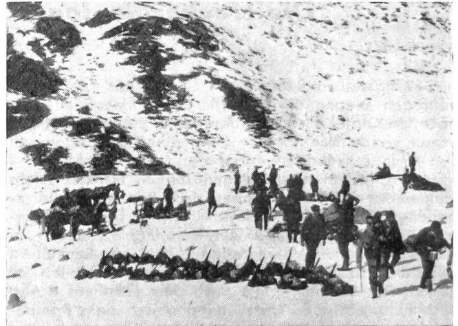
Geb.Füs.Kp. 11/92 bei der Keschkütte, Oktober 1943.

Landsturmmann schon die Grenzbesetzung 1914 bis 1918 aktiv mitmachten.