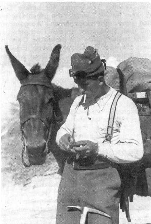
Säumer auf dem Fornogletscher, Sommerhochgebirgskurs 1940.

Bei unseren Gebirgstruppen, die sich ausschließlich aus Graubünden rekrutieren, hatten wir anfänglich sehr wenig Leute, die für den Militärdienst genügend skifahren konnten. Obwohl bei unseren Vorgesetzten unbegreiflicherweise noch hie und da die nötige Ein-