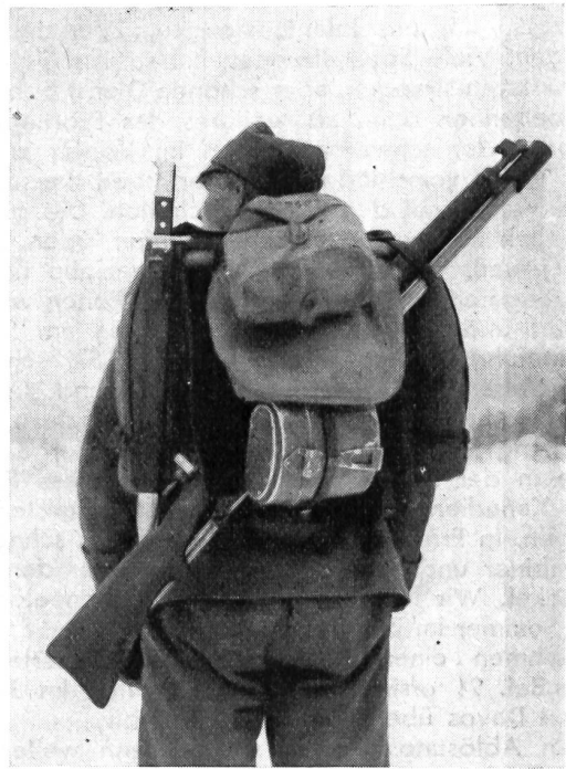
In Ermangelung von Rucksäcken mußten zum Skifahren Karabiner, Sondierstange und Faschinenmesser unter den Tornisterdeckel geschnallt werden.

Zwei volle Tage dauerte die Inspektion des Kurses durch unseren damaligen, gestrengen Brigadekommandanten, Oberstbrigadier von Erlach. Die Truppe hatte