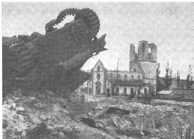
So sieht das Dorf Mittelwihr heute noch aus. Im Vordergrund ein zerschossener deutscher Tank.

Unter dem Titel «Die Not ist groß» haben wir im «Schweizer Soldat» vor einiger Zeit über die gräßlichen Zustände im kriegsversehrten Ausland berichtet. Eine Fahrt durchs Elsaß bestätigte von neuem, daß noch überall schwere Wunden klaffen, daß die notwendigsten Gebrauchsgegenstände des täglichen Lebens vielerorts gänzlich fehlen und daß allgemein Verhältnisse vorherrschen, welche aktive schweizerische Hilfe als dringend erscheinen lassen. Das furchtbare Antlitz des Krieges blickt uns hier entgegen, ein Bild der Zerstörung als Ausfluß menschlichen Hasses. Vor diesem Elend können wir uns bewahren, wenn die Armee stets bereit und auf der Höhe ihrer Aufgaben bleibt. Was wir im Bilde sehen, sind die unmittelbaren Spuren des Krieges, gleichzeitig aber die mittelbaren Folgen mangelhafter Abwehrbereitschaft! E. Sch.