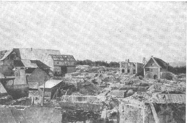
Mittelwihr, einst ein blühendes Dorf aus der berühmten Elsässer Weingegend, wurde zu über 90 Prozent zerstört.