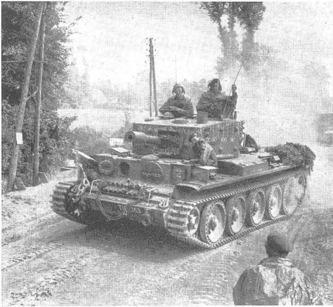
«Cromwell»-Panzerkampfwagen mit 95-mm-Haubitze ausgerüstet.

ministerium mit, daß die Herstellung dieses Tanks eingestellt worden sei. Die Bewaffnung des «Centaur»-Tanks besteht aus einem sechspfündigen Geschütz (57 mm) und hat eine Besatzung von vier Mann. Es lag damals auf der Hand, daß ein verbessertes Modell oder sogar ein neuer Kreuzertank sich in Vorbereitung oder bereits in Massenproduktion befinden mußte. Das Vorhandensein des «Cromwell»-Panzerkampfwagens wurde jedoch erst drei Monate später offiziell bekannt gegeben. Bestimmte technische Einzelheiten werden jedoch auch heute noch geheim gehalten, obwohl einige Tanks während der Offensive in Frankreich in deutsche Hand fielen. Der rasche Vorstoß der alliierten Truppen und die damit entstandene Verfolgung der 7. deutschen Armeegruppe gestattete es den Deutschen nicht, eine genaue technische Untersuchung der erbeuteten Modelle durchzuführen, so daß eine detaillierte Beschreibung dieses Tanktyps britischerseits für den Augenblick nicht bekanntgegeben werden darf. Die faktische Entwicklung in den letz-