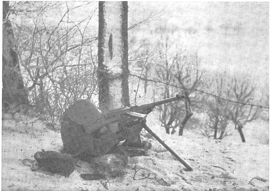
Laf. Lmg. beim Ueberschießen eines angreifenden Inf.-Zuges.

In der Praxis vollzieht sich das Verfahren wie folgt: Das Lmg. wird mit richtig gewähltem Visier gegen das Ziel, zum Schießen gegen dieses, eingerichtet. Es wird geschossen. Eigene Truppen gehen vor und befinden sich im Moment in einer Entfernung (geschätzt oder gemessen) von beispielsweise 300 m vor der Waffe. Die Sicherheitsvisier-Tabelle ergibt ein Sicherheitsvisier von 1400 m. Jetzt wird dieses Visier gestellt, ohne das Lmg. sonst zu verstellen. Festzustellen ist nun: Zeigt die 1400-m-Visierlinie über, auf oder unter die eigenen Truppen. Das erstere sei der Fall. Die Sicherheitsvisierlinie zeigt also um irgendeinen Betrag über die vorgehenden; ebenso wenig wie das Maß aussagt, um welches diese Linie die Truppen überhöht, ebenso gleichgültig ist, gegen was für einen Geländeteil sie zielt. Das Resultat lautet einfach: Es darf jetzt (noch) überschossen werden. Während des Weiterschießens (mit ursprünglichem