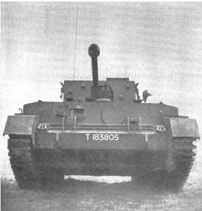
Der «Centaur»-Panzerkampfwagen, ein Vorläufer des «Cromwell»-Tanks. Bewaffnung besteht aus einem Sechspfünder-Geschütz

ministerium mit, daß die Herstellung dieses Tanks eingestellt worden sei. Die Bewaffnung des «Centaur»-Tanks besteht aus einem sechspfündigen Geschütz (57 mm) und hat eine Besatzung von vier Mann. Es lag damals auf der Hand, daß ein verbessertes Modell oder sogar ein neuer Kreuzertank sich in Vorbereitung oder bereits in Massenproduktion befinden mußte. Das Vorhandensein des «Cromwell»-Panzerkampfwagens wurde jedoch erst drei Monate später offiziell bekannt gegeben. Bestimmte technische Einzelheiten werden jedoch auch heute noch geheim gehalten, obwohl einige Tanks während der Offensive in Frankreich in deutsche Hand fielen. Der rasche Vorstoß der alliierten Truppen und die damit entstandene Verfolgung der 7. deutschen Armeegruppe gestattete es den Deutschen nicht, eine genaue technische Untersuchung der erbeuteten Modelle durchzuführen, so daß eine detaillierte Beschreibung dieses Tanktyps britischerseits für den Augenblick nicht bekanntgegeben werden darf. Die faktische Entwicklung in den letz-