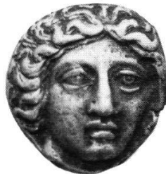
45 bis *