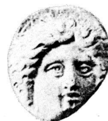
Collection Jameson 1549