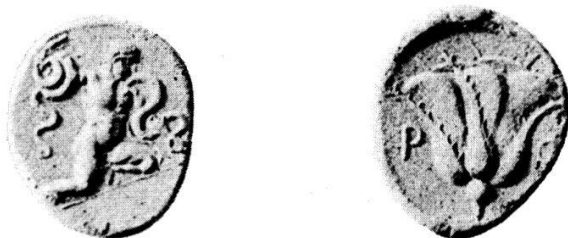
Tridrachme symmachique de Rhodes

La série à la couronne qui suit est d'un style tout à fait différent. Nous pensons tout de même qu'elle est ici à sa place, car les boutons accompagnant la rose du revers, qui descendaient toujours dans les séries précédentes comme ici, pointeront