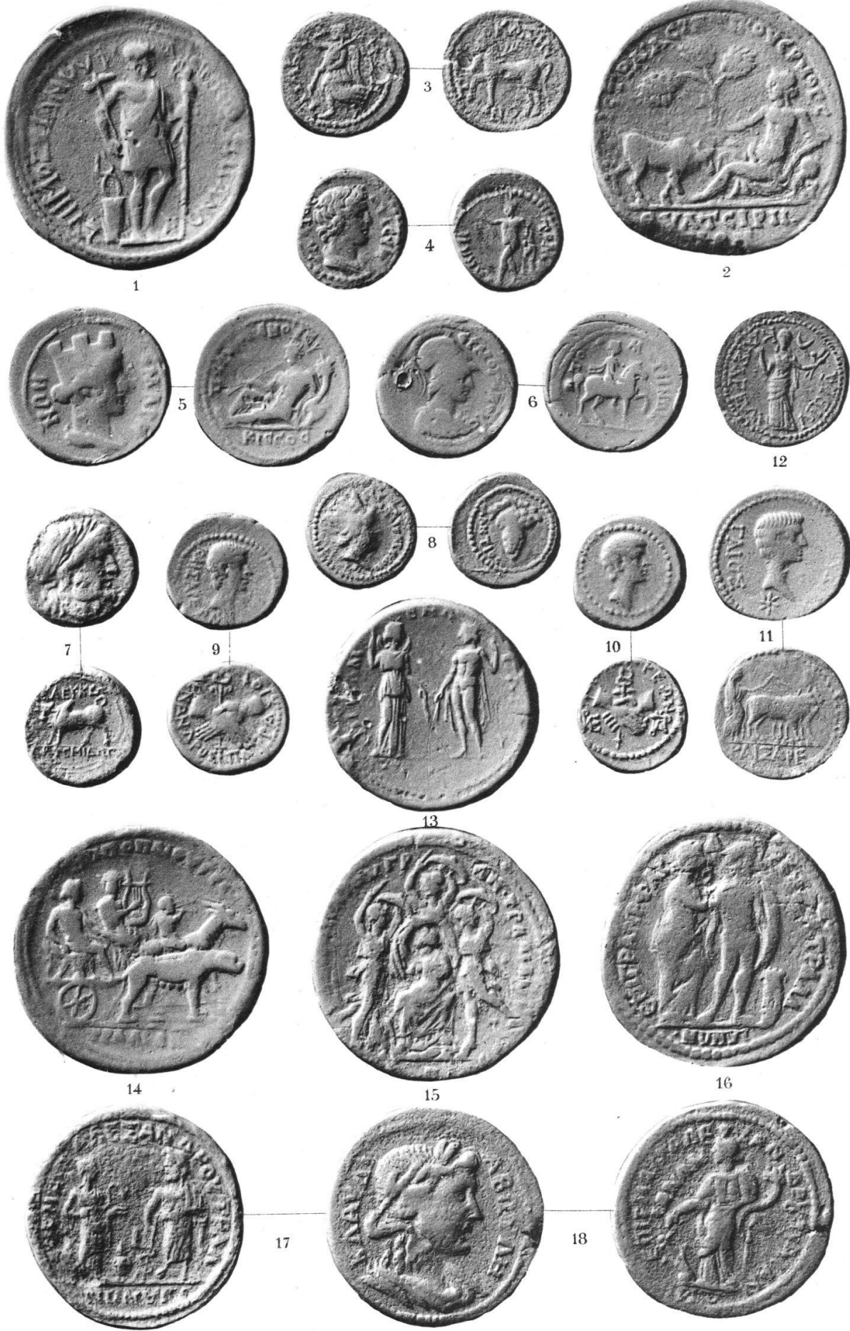
THYATEIRA. TITAKAZOS. TOMARIS. TRALLEIS.