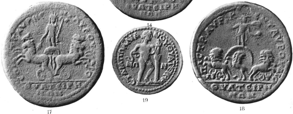
SILANDOS TABALA THYATEIRA.