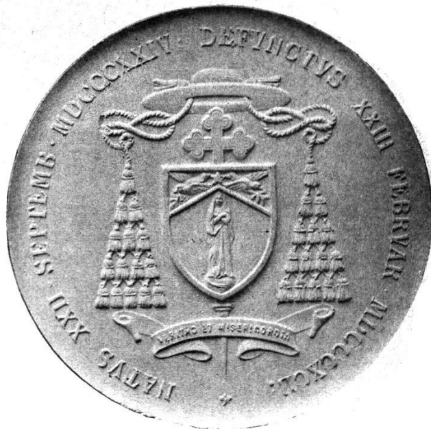
MÉDAILLES DE M gr MERMILLOD, DE M. M. L. RUCHONNET ET J. E. DUFOUR.