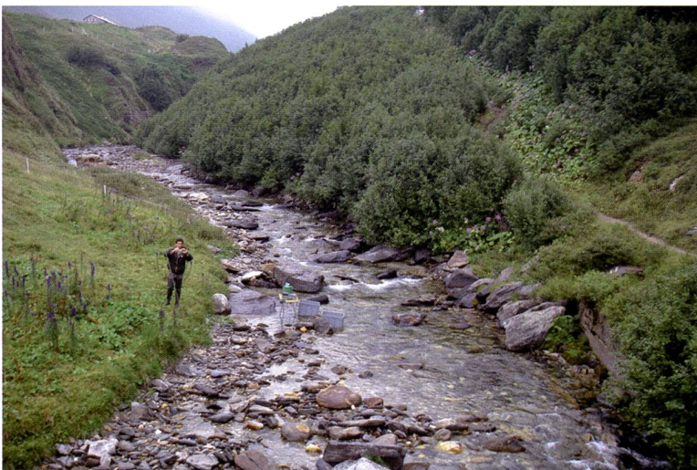
Fig. 3 – Murinascia Grande: stazione a monte della capanna di Cadagno.