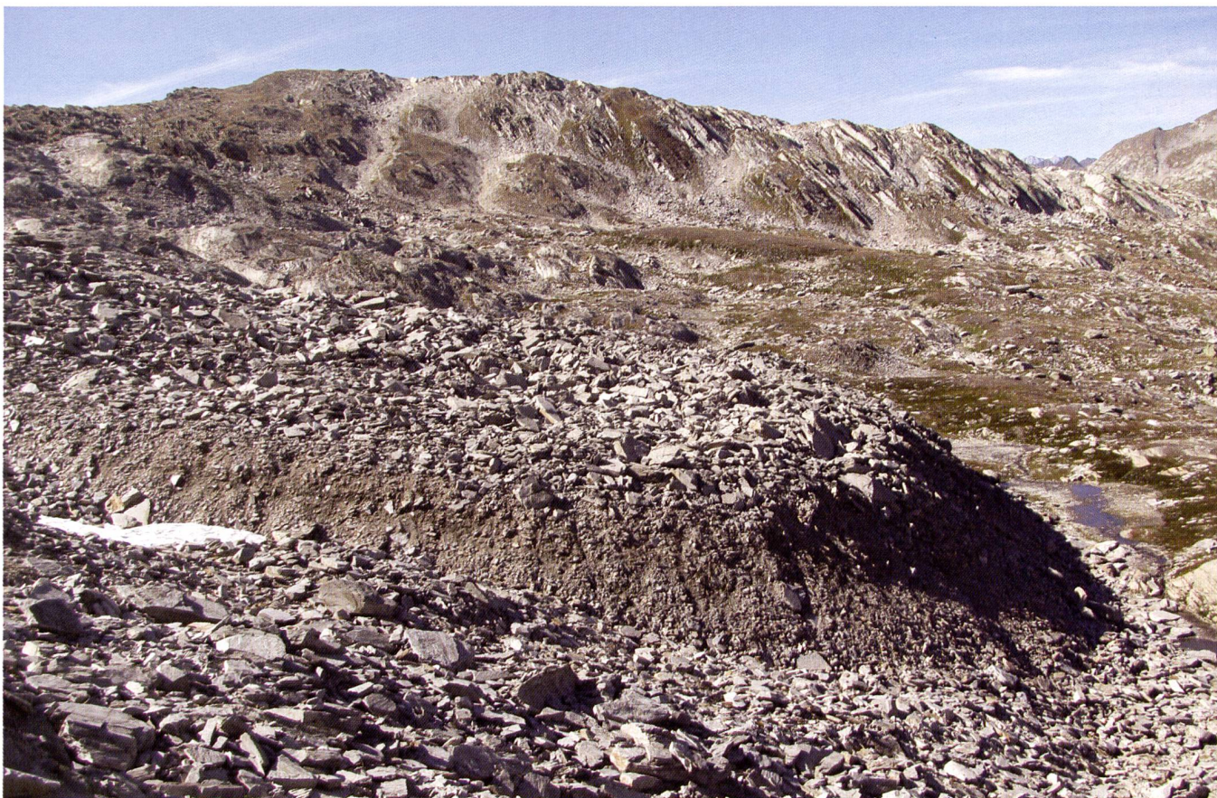
Foto 10 – Vista della parte frontale del rock glacier attivo dei Ganoni di Schenadiüi (Val Cadlimo).