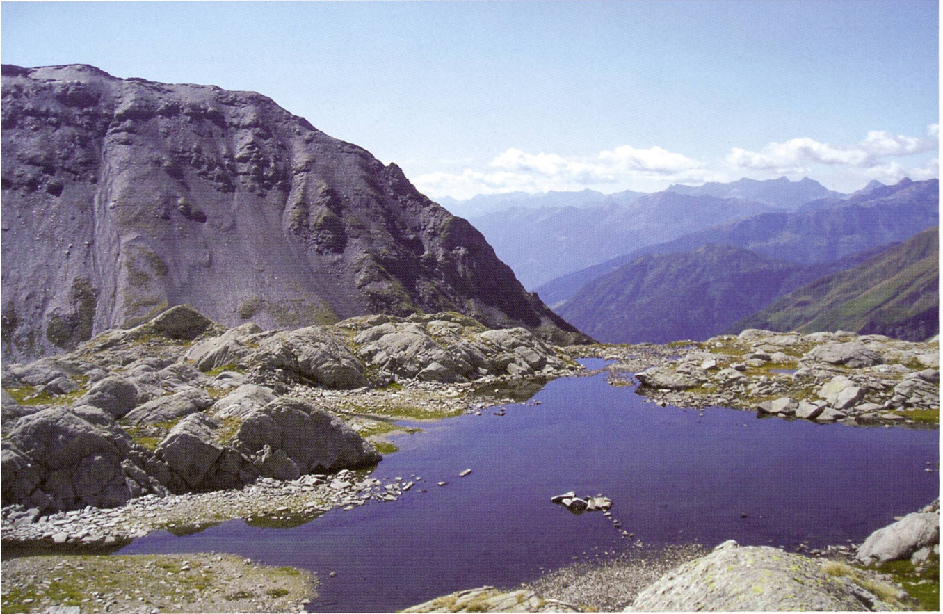
Foto 7 – Laghetto nella parte occidentale dei Cogn dei Lavazz (Greina).