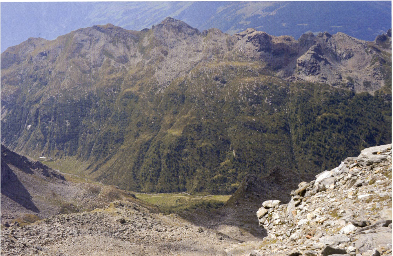
Foto 8 – Il versante sinistro della Val di Carassino, con i suoi numerosi rock glacier relitti.