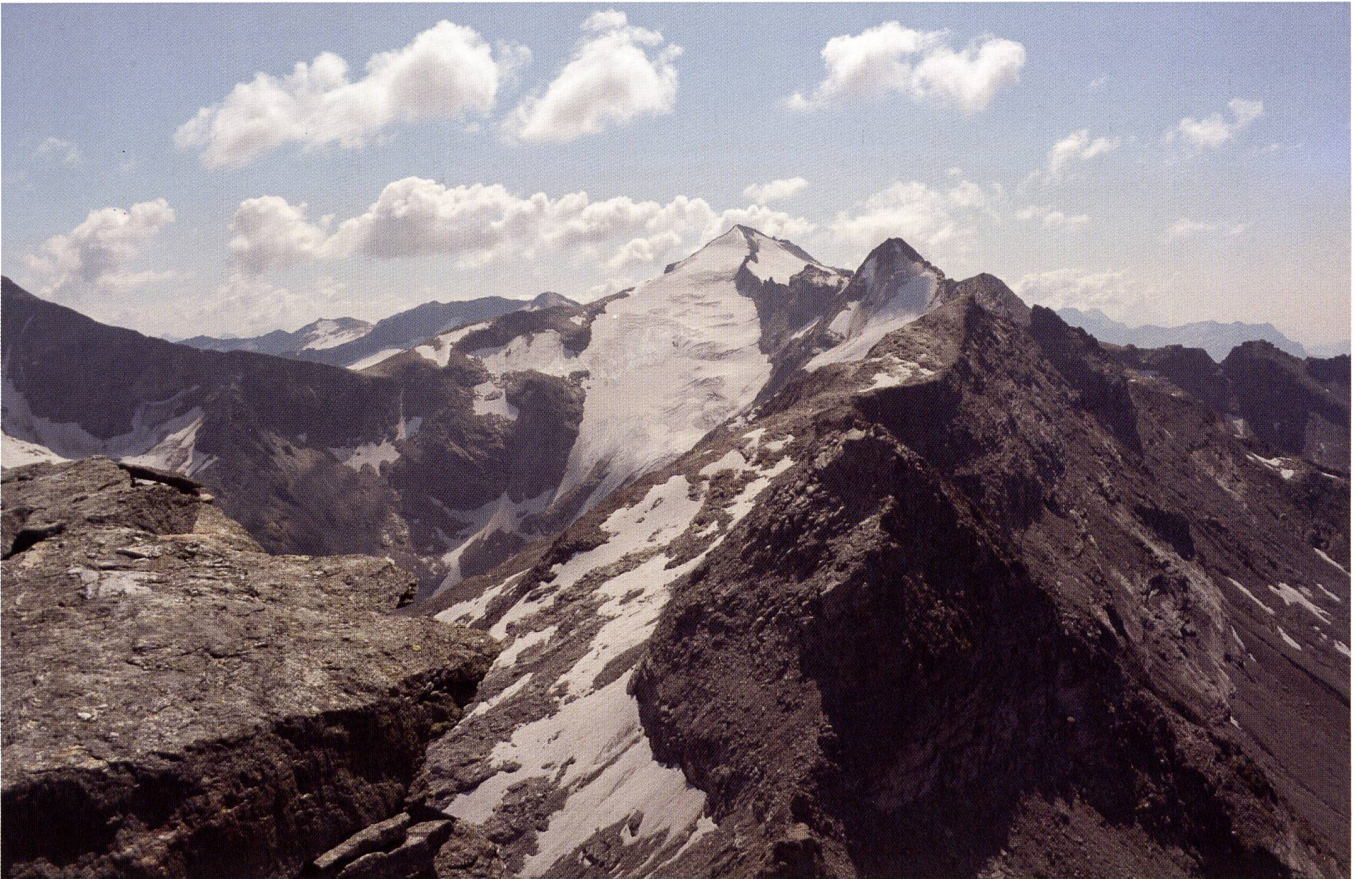
Foto 6 – Il versante orientale del massiccio dell'Adula a settembre 2009. In secondo piano, il Läntagletscher.