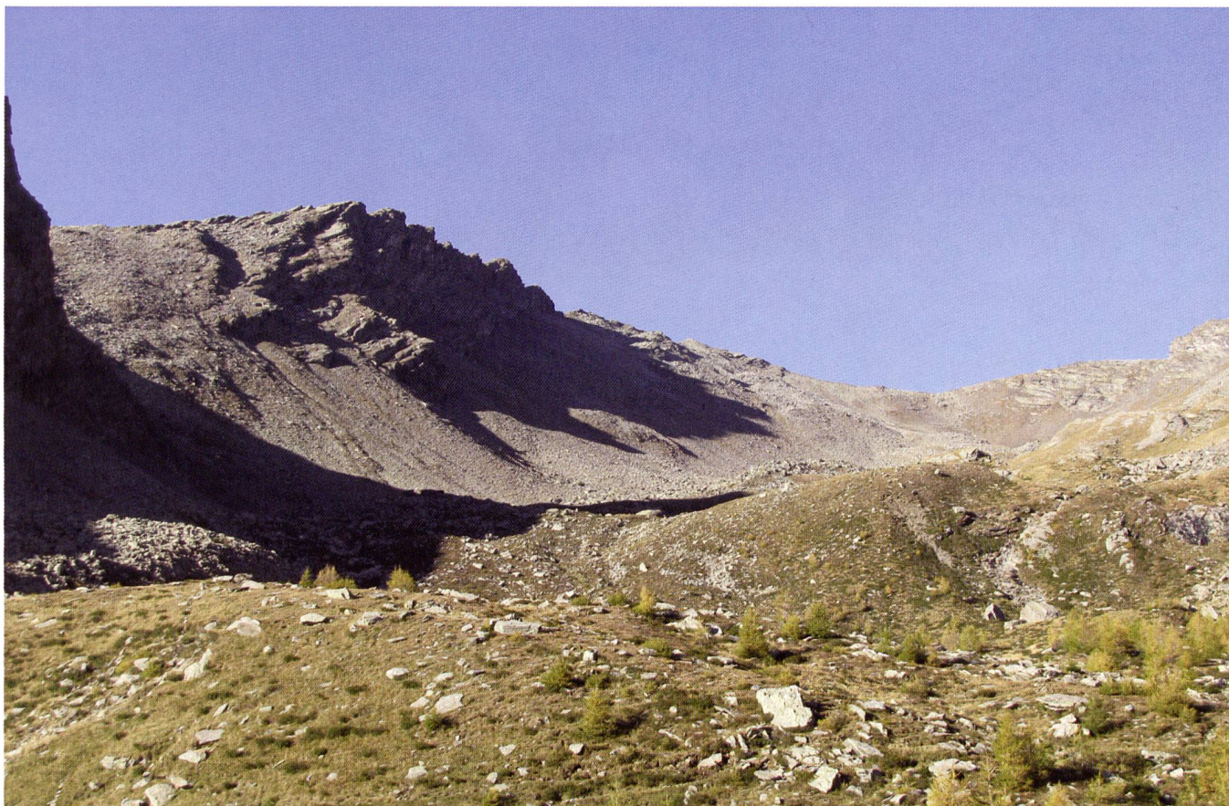
Foto 9 – Le falde di detrito della Valle di Sceru (Val Malvaglia).