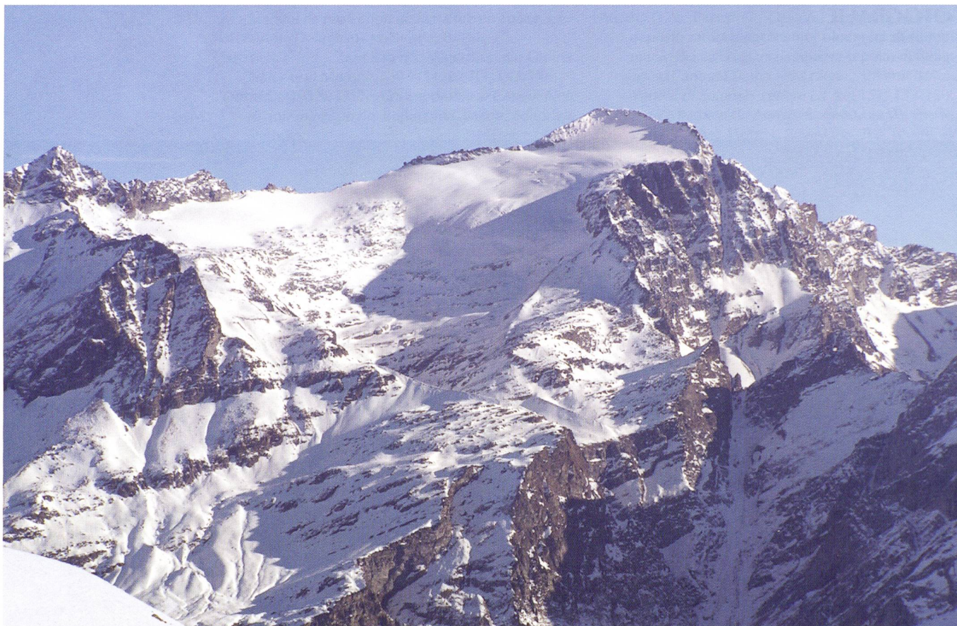
Foto 3 — La cima dell'Adula e il Vadrecc di Bresciana in inverno visti dalla regione del Nara.