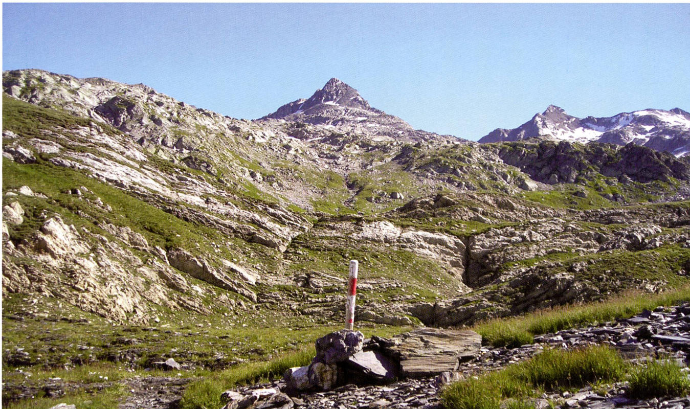
Foto 1 – Veduta del Piz Gaglianera e del Piz Vial, regione della Greina.