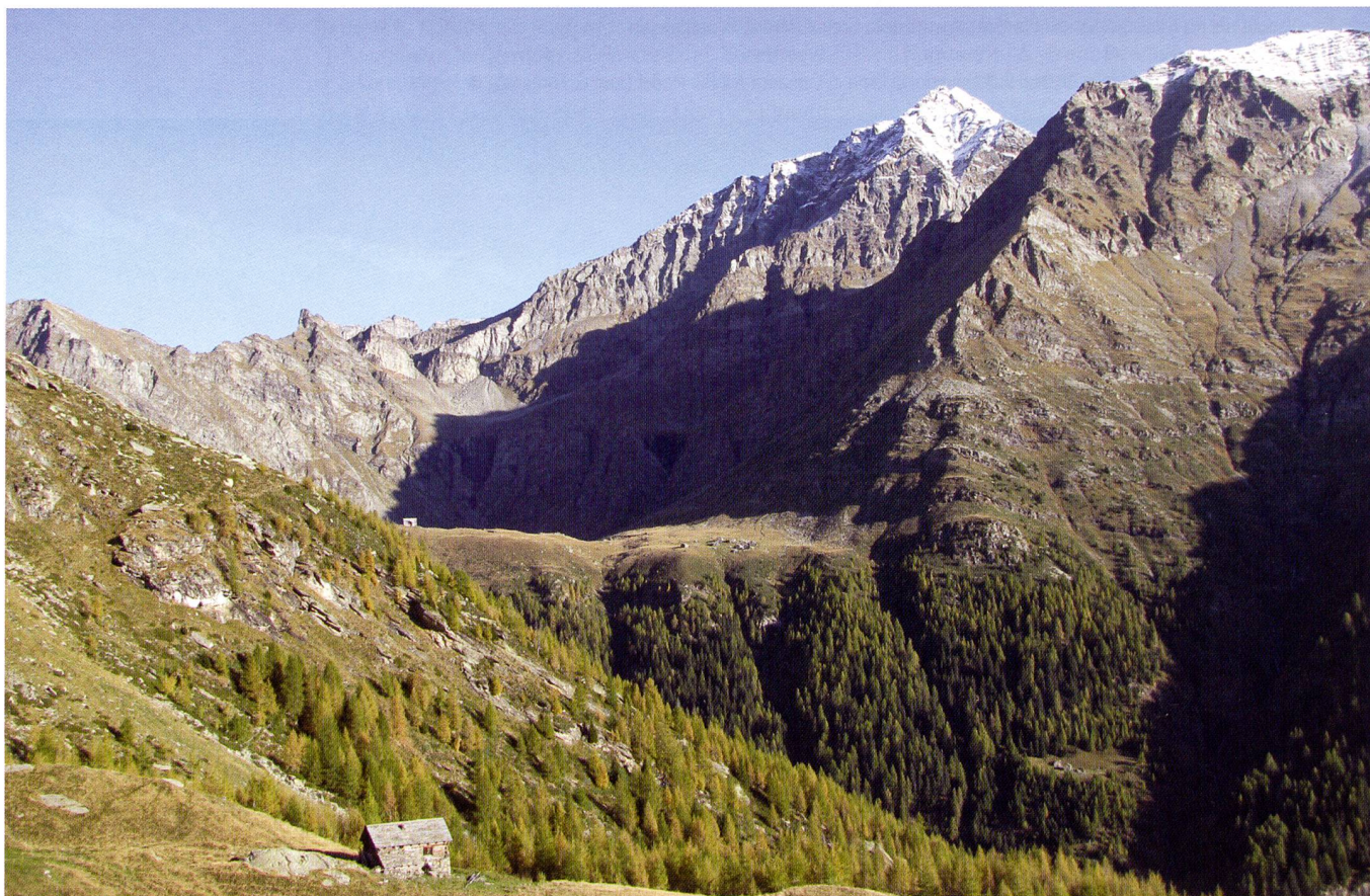
Foto 4 — La conca glaciale dell'Alpe di Quarnei (Val Malvaglia).