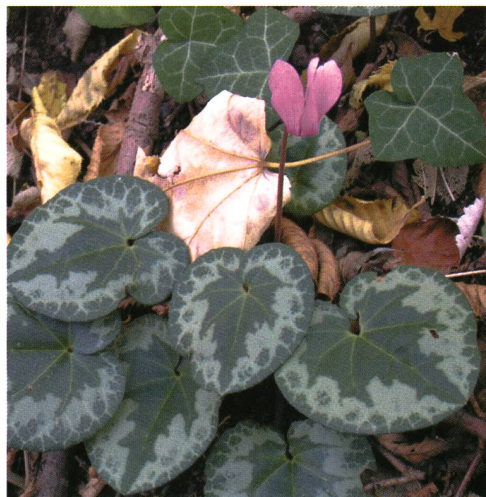
Fig. 9 – Cyclamen purpurescens .

alcuni casi di specie osservate all'inizio del rilevamento (1998), sussiste un'incertezza sull'attribuzione del nome esatto per mancanza di una successiva verifica e per la perdita di documentazione dovuta a un incen-