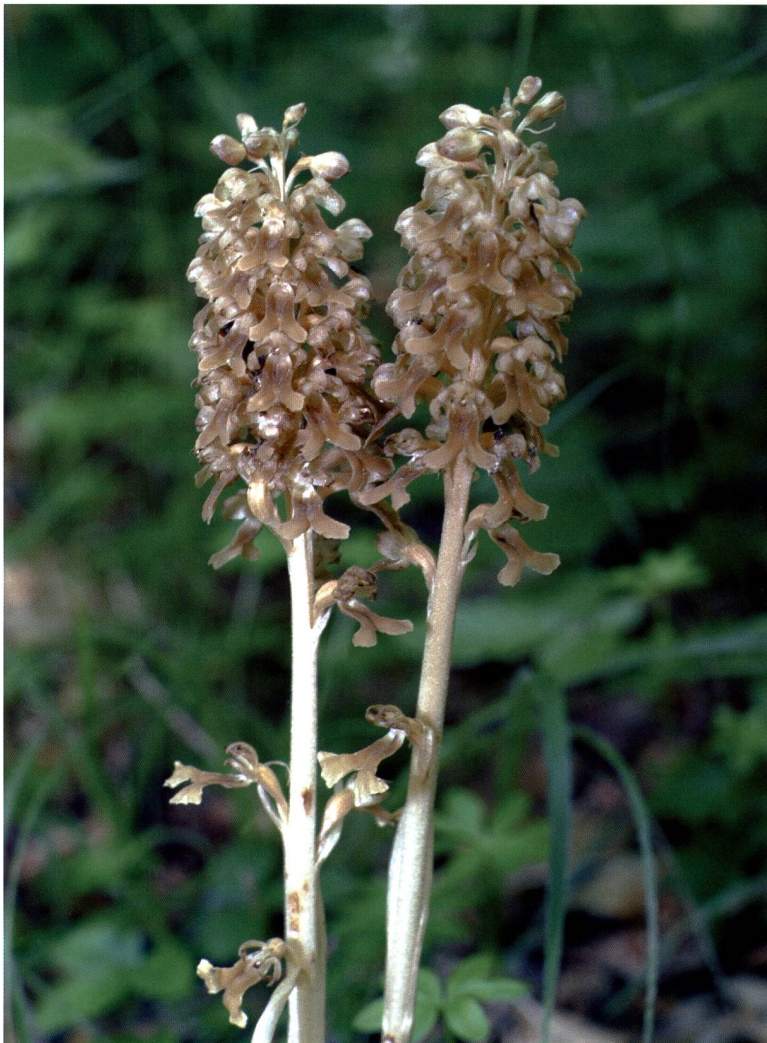
Fig. 5 – Neottianidus-avis .

comunque la pena segnalare alcuni ambienti molto suggestivi, a cominciare dalle pareti di tufo in prossimità del Ponte del Farügin, dove fa bella mostra di sé la Saxifraga rotundifolia , in fiore da maggio a giugno. Nella gola appena a monte del ponte è invece pre-