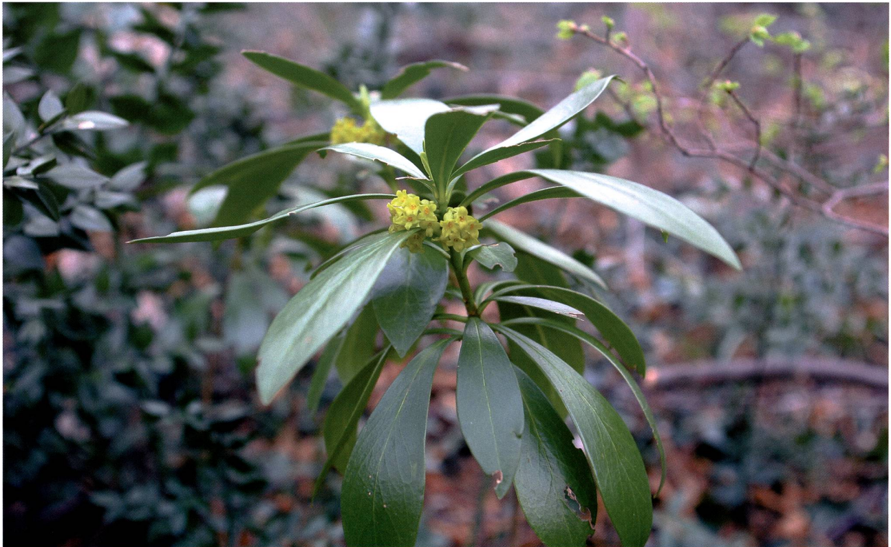
Fig. 2 – Allium ursinum .