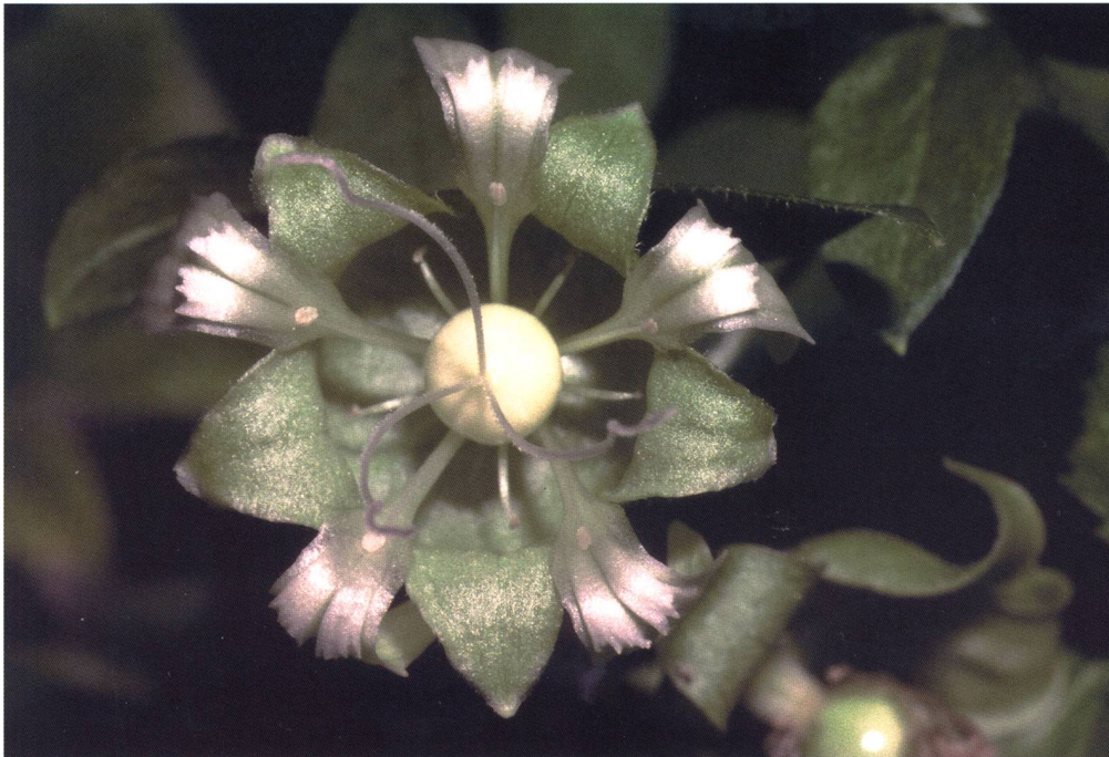
Fig. 6 – Cucubalus baccifer .

Svizzera ed è conosciuto solo in alcune parti del Ticino e Mesolcina, Ginevra e Grigioni (Oberhalbstein). Il C. bacciferus è una pianta piuttosto esigente e di conseguenza con una distribuzione molto limitata: richiede infatti la presenza contemporaneamente di un terreno ricco di sostanze nutritive, umido fino a molto umido, leggermente basico (pH da 5.5 a 8), e di un luogo ombreggiato e molto caldo, senza gelate tardive o grosse escursioni termiche.