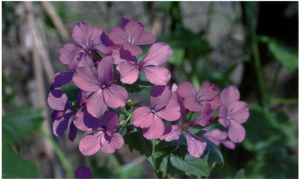
Fig. 4 – Lunaria rediviva .

comunque la pena segnalare alcuni ambienti molto suggestivi, a cominciare dalle pareti di tufo in prossimità del Ponte del Farügin, dove fa bella mostra di sé la Saxifraga rotundifolia , in fiore da maggio a giugno. Nella gola appena a monte del ponte è invece pre-