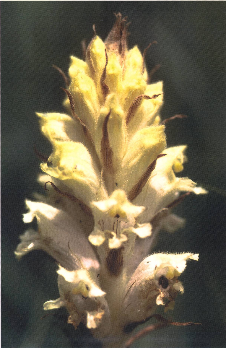
Fig. 8 – Orobanche lutea .

alcuni casi di specie osservate all'inizio del rilevamento (1998), sussiste un'incertezza sull'attribuzione del nome esatto per mancanza di una successiva verifica e per la perdita di documentazione dovuta a un incen-