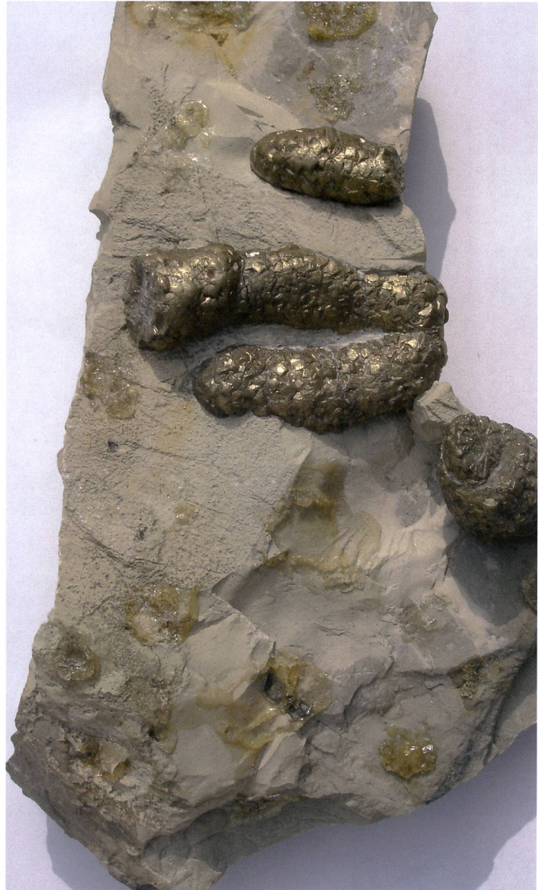
Fig. 2 – Noduli di pirite nella roccia madre (Maiolica).

Le caratteristiche mineralogiche e giaciture dei noduli suggeriscono una crescita bifase, iniziata con la nucleazione di aggregati nodulari raggiati, costituiti da cristalli allungati di marcasite, successivamente sostituiti da pirite. La precipitazione della marcasite è