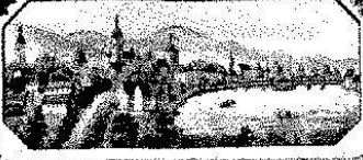
Rheinfelden vom Saline-Belvoir