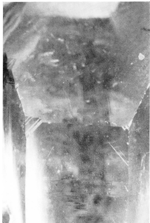
Fig. 4. (R-L)-Quarz aus dem Val Caverein, mit Amiant- und Chloriteinschluss.