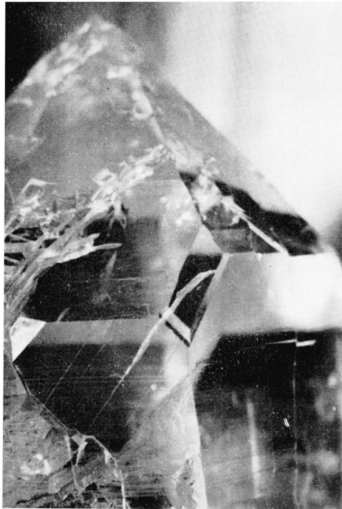
Fig. 6. (R-L)-Quarz aus dem Etlital mit Amianteinschluss. (Vergrößerung der Fig. 1—6 ca. 3\times )

Die Tabelle (wie auch die folgende) gibt kein ganz genaues Zahlenverhältnis wieder, da es sich bei den als Einheiten aufgeführten Quarzen teils um Einzelkristalle, teils um Grüppchen von zwei, drei oder mehr Spitzen handelt.