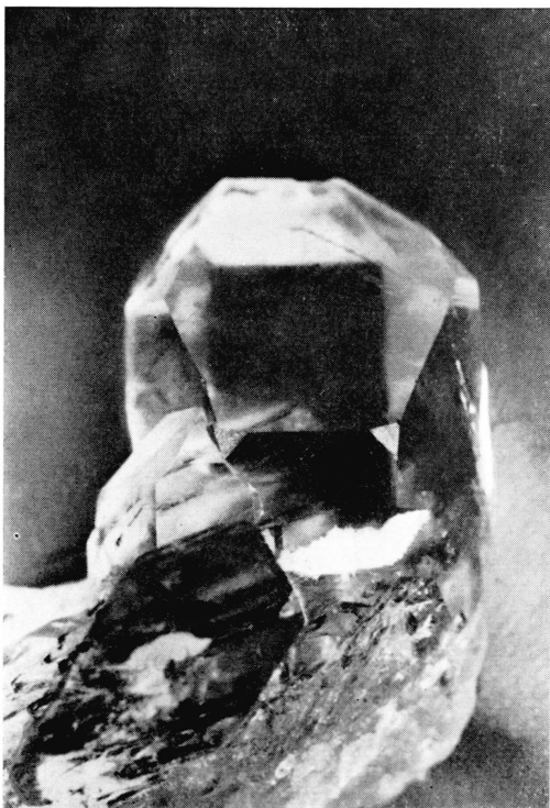
Fig. 3. (R-L)-Quarz aus dem Sellenertobel, mit Epidot- u. Amianteinschluss.