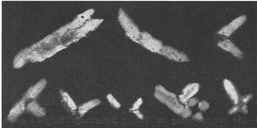
Fig. 26: Vergrößerung ca. 150 \times . Nikols gekreuzt.

Bei stärkerer Vergrößerung (etwa 200 \times ) zeigen sich die Quarzkristalle zum Teil erfüllt von kleinen Einschlüssen. Sericitschüppchen sind dabei an erster Stelle zu nennen; ganz untergeordnet kommen auch andere Mineralien als Einschluss in unseren Quarzneubildungen vor. Die Sericitschüppchen liegen nicht regellos, sondern a) offensichtlich \pm parallel den Rhomboederflächen und b) eine gewisse Zonarstruktur andeutend (Fig. 21). Neben Kristallen, die sehr reich an Einschlüssen sind, kommen auch nahezu einschlussfreie vor.