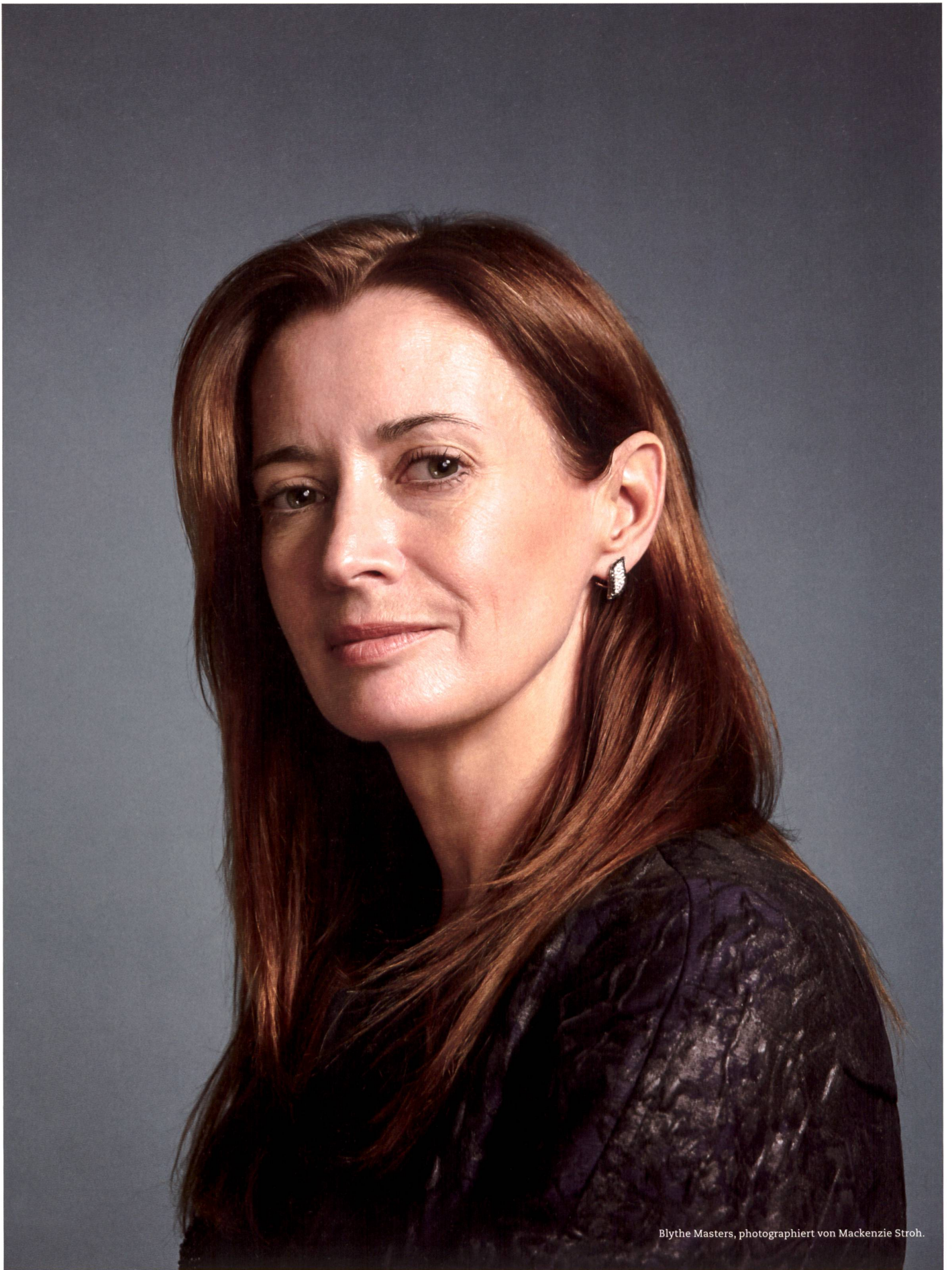
Blythe Masters