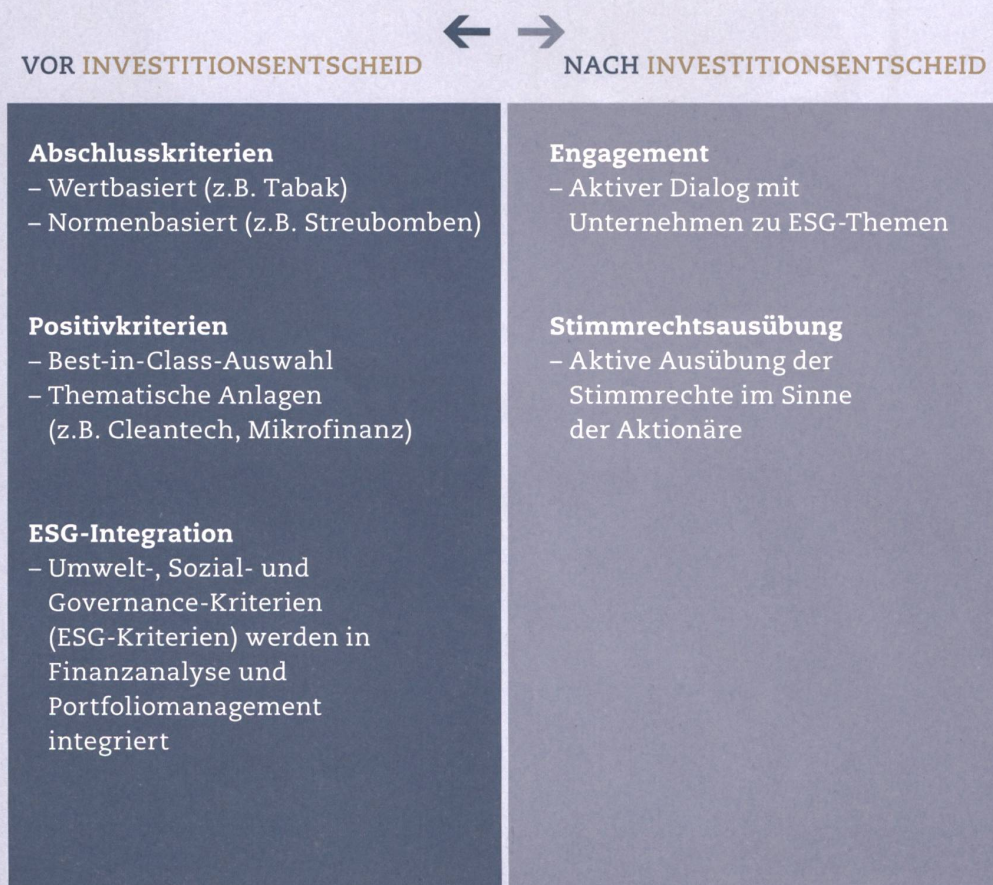
Abbildung I: In der Schweiz angebotene Formen nachhaltiger Anlagen

Grundsätzlich lassen sich nachhaltige Anlagen in zwei Gruppen unterteilen. Im einen Fall wählt man unter Berücksichtigung von ESG-Kriterien spezifische Investments aus. Die Anwendung dieser Nachhaltigkeitskriterien führt also zu einem «nachhaltigen» Investmentportfolio. Im anderen Fall bilden die ESG-Kriterien die Basis für einen Dialog mit Unternehmen, in die man investiert. Ziel ist es dabei, ein Unternehmen so zu beeinflussen, dass es die Leistung in ESG-Bereichen verbessert und damit letztlich langfristig erfolgreicher wirtschaftet. Abbildung 1 klassiert verschiedene am Markt verfügbare Ansätze in diese zwei Gruppen.