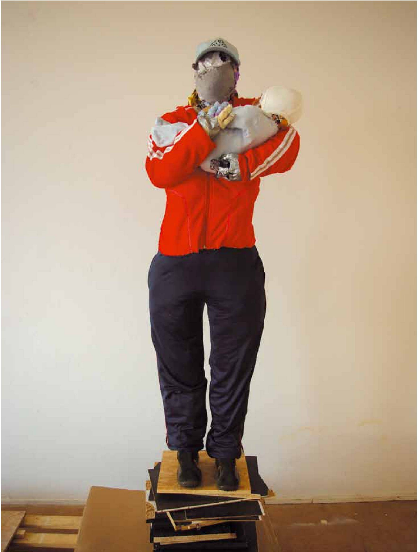
«M#7», Kleidung, Textilien, Klebeband, Folie, Metallgerüst, Höhe ca. 1,65 m, 2008