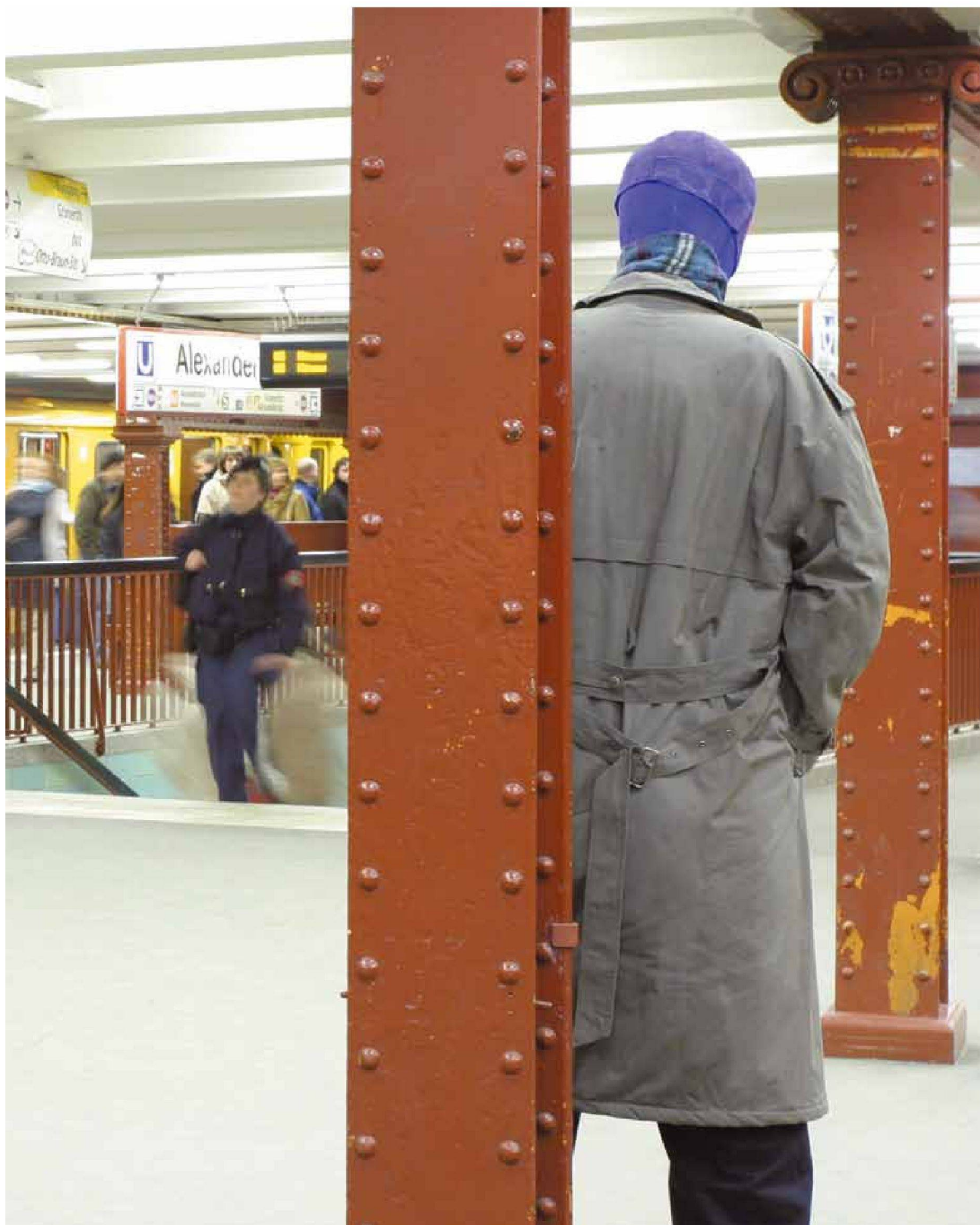
«Superheroes», Kleider, Textilien, Schuhe, Metallgerüst, lebensgross, 2005, U2 Alexanderplatz, Berlin