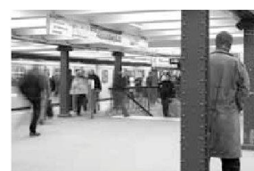
S. 34 / 35