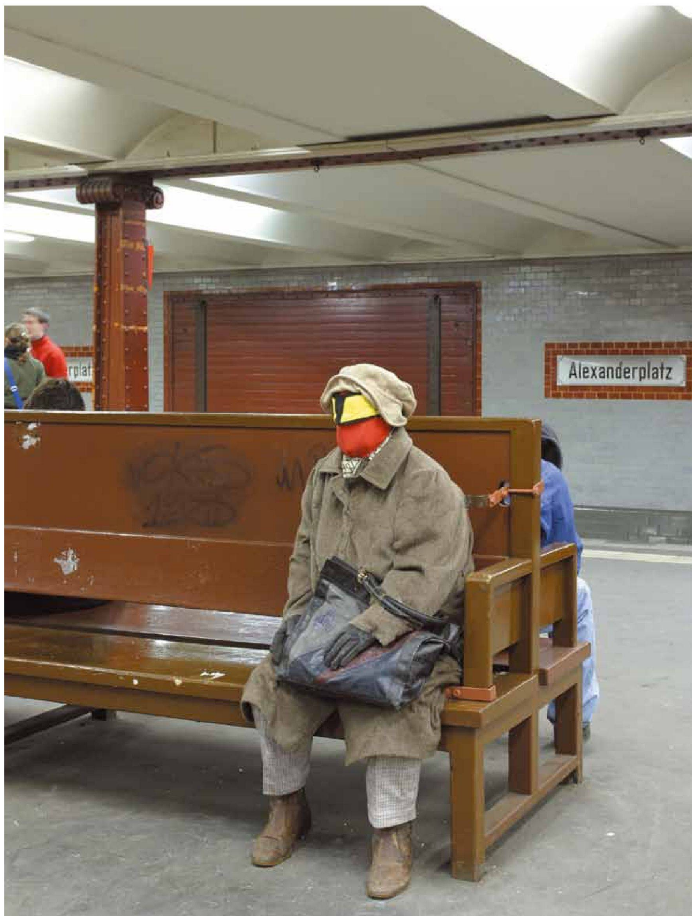
«Superheroes», Kleider, Textilien, Schuhe, Metallgerüst, lebensgross, 2005, U2 Alexanderplatz, Berlin