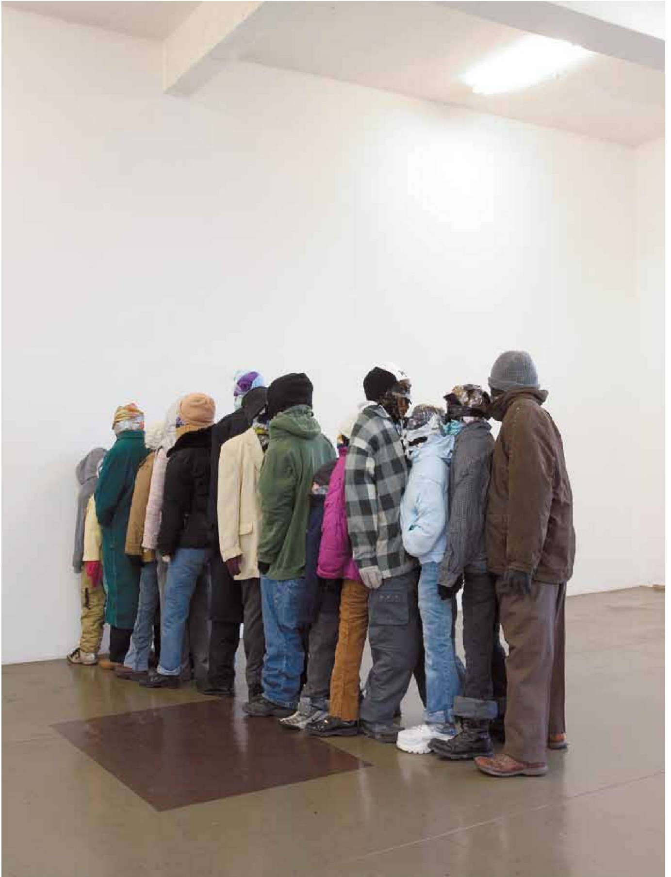
«Reihe», Kleidung, Textilien, Klebeband, Metallgerüst, lebensgrosse Figurengruppe, Grösse variabel, 2006