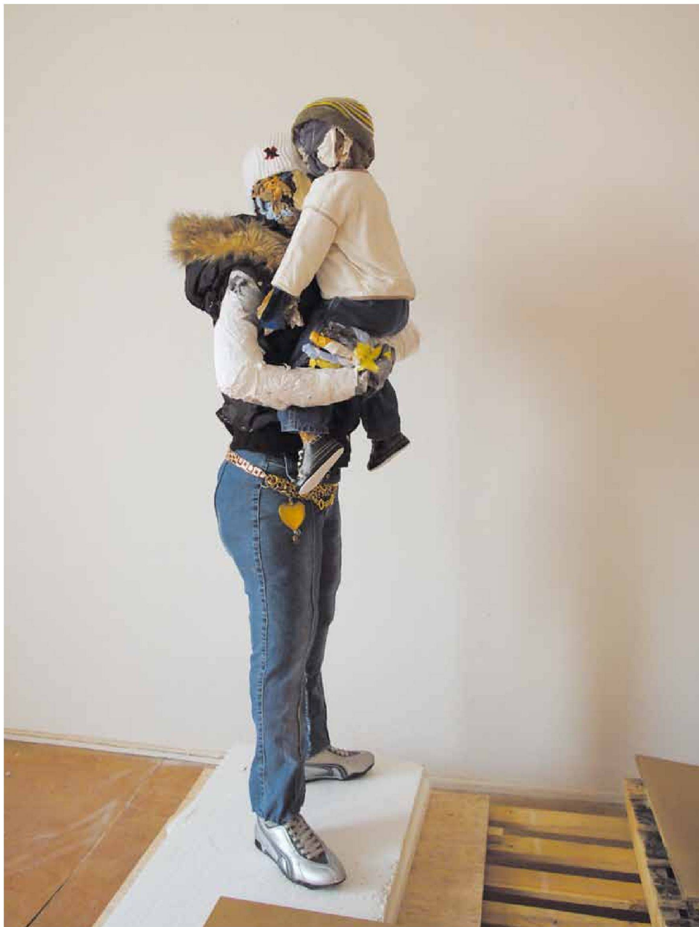
«M#8 », Kleidung, Textilien, Accessoires, Klebeband, Folie, Metallgerüst , Höhe ca. 1,65 m, 2008