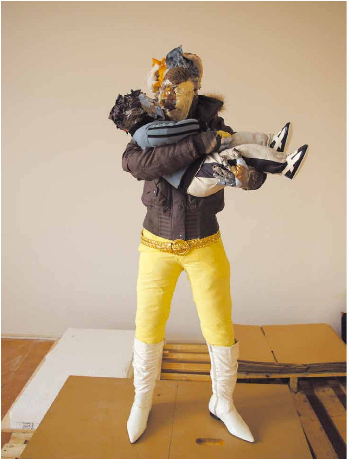
«M#6 », Kleidung, Textilien, Accessoires, Klebeband, Folie, Metallgerüst , Höhe ca. 1,60 m, 2008