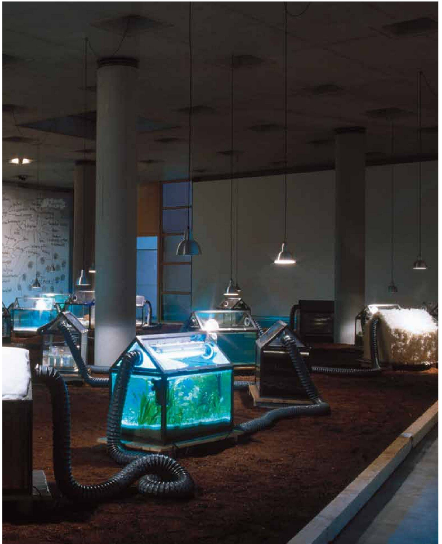
«Herne Modell», Installation, Museum für Archäologie, Herne 2006