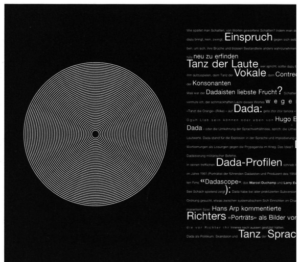
Grafik: Hans Schmid

Dada oder die Kunst der Gegen-Kunst: Das Anti als Kunstakt – Schwitters, Huelsenbeck, Herzfelde, Doesburg,