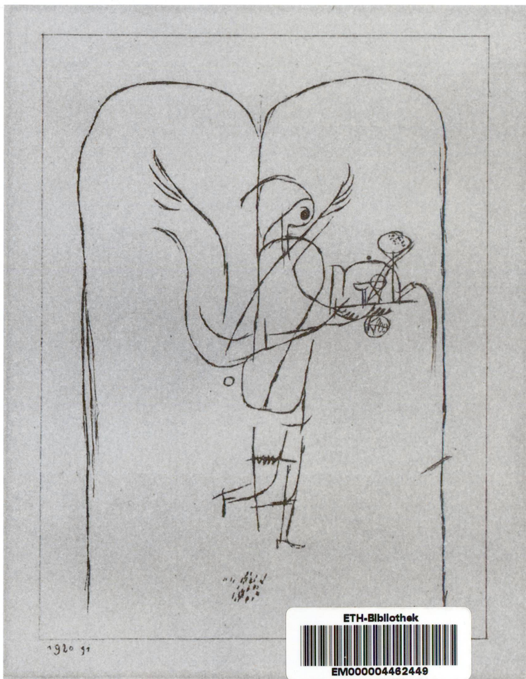
Freiwilligenarbeit, Milizprinzip und Sozialengagement Paul Klee (1879–1940); Engel bringt das Gewünschte, nach 1915/29, 1920, 91; Lithographie, 1. Zustand; 19,6 x 14,5 cm; Paul Klee-Stiftung, Kunstmuseum Bern, Inv.-Nr. G 60.