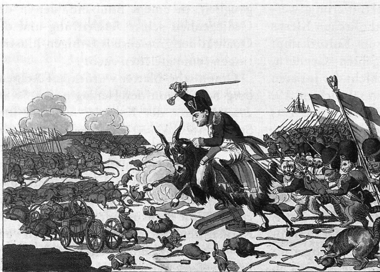
Die grösste Heldenthat des neunzehnten Jahrhunderts oder Eroberung der Insel Helens.

Johann Michael Voltz? 1815, Radierung, koloriert. Herkunft unbekannt (aus dem besprochenen Band).