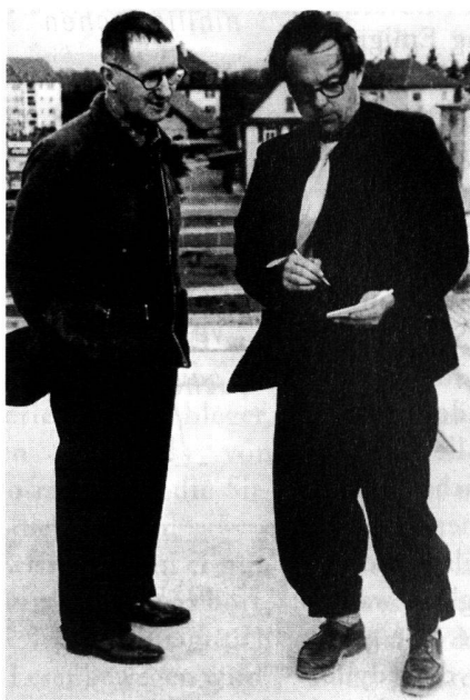
Bertolt Brecht und Max Frisch 1947 in Zürich.

Liest man Brechts Gedichte im Zusammenhang, dann gerät man unwillkürlich ins Sprechen und trägt sich selbst eines ums andere vor; denn sie verführen zur Rezitation, sind geschrieben, um uns aufhören zu lassen. Zwar merkt man noch den späten Gedichten die Patenschaft Villons und Rimbauds an, insbesondere aber jene Schillers. Das Poetische Brechts verdankt sich wesentlich einer Verbindung aus