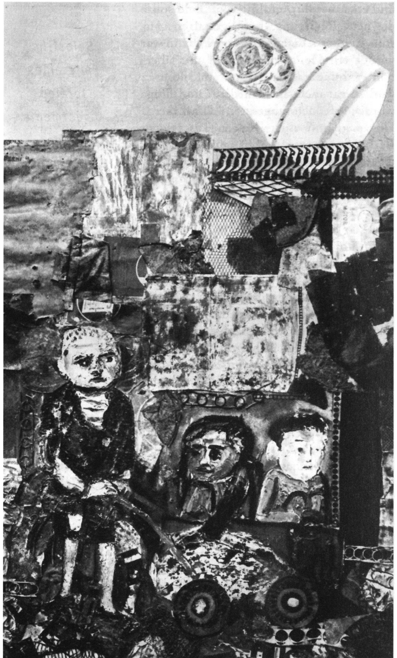
Ein Kosmonaut grüsst Juanito Laguna, von Antonio Berni. Das Symbol unseres elektronischen und spazialen Zeitalters beunruhigt das Dasein der Kinder in der Pampa in keiner Weise.

Wie von E. S. Savas hervorgehoben («The Key to Better Government», 1987), «erfordert die Einführung des Wettbewerbs eine bewusste Strategie zur Schaffung von Alternativen und zur Förderung der Akzeptanz und einer Einstellung, welche dem Bürger als Benützer öffentlicher Dienste Wahlmöglichkeiten zugesteht. Im Dienstleistungsbereich sind Optionen wesentlich». Regierungen, die versuchen, die Einkünfte zu maximieren, können interessierten Käufern Monopolrechte garantieren. Als ich 1987 Minister wurde, hatte Argentinien zwei inländische Fluggesellschaften, doch gehörten beide dem Staat. Ein Zusammenschluss war projektiert, bei dem die größere Gesellschaft (Aerolineas) die kleinere (Austral) verschlingen sollte. Ich stoppte