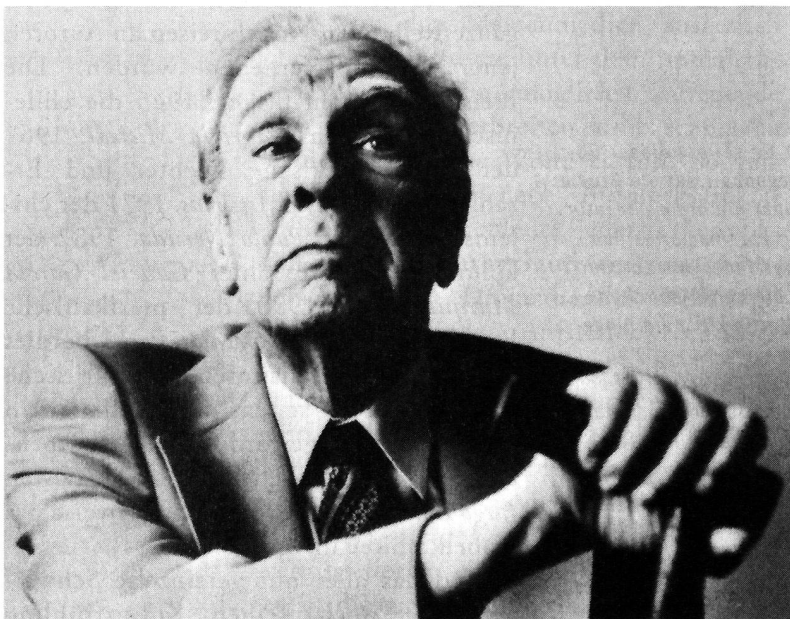
Jorge Luis Borges.

Weshalb kommt der identitätsstiftenden Funktion von Literatur in Lateinamerika eine so grosse Bedeutung zu? Trotz der Gunst der Sprachsituation ist das Bewusstsein einer kulturellen Zusammengehörigkeit erst zu Beginn unseres Jahrhunderts erwacht. Die nach 1810 entstehenden jungen Republiken waren nicht viel mehr als rhetorisch zusammengehaltene, streitsüchtige Territorien nach aussen und auf Eigennutz bedachte Ausbeutergesellschaften im Inneren. Dass ein so gewaltiges Gebiet trotz seiner topographischen und klimatischen Vielfalt und bei einer rassistisch so durchmischten Einwohnerschaft zu einer gemeinsamen kulturellen Identität finden konnte, ist das Ergebnis eines Prozesses, bei dem die Literatur die entscheidende Rolle spielte. Sie hat auf übernationaler Ebene eine identifizierende Funktion erfüllt, wie sie in solchem Ausmass auf keinem anderen Kontinent zu beobachten ist. Die Literatur hat dort – gleichermassen wie die Sprache auf der Kommunikations-