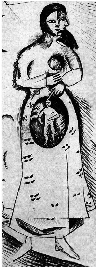
Marc Chagall, Ausschnitt aus: Schwangerschaft 1912/13 , Sammlung E.W.K., Bern.

Wir haben nun das Instrumentarium beisammen, welches uns erlaubt, das Streben nach Wachstum besser zu verstehen. Die Beweggründe zu diesem Konsens des mainstreams liefern die primären Strebungen: Deshalb finden wir die Befürworter aus den Lagern aller politischen Richtungen. Es werden Gefühle mobilisiert, die «vorrational» angesiedelt sind. Die seelischen Kräfte, die hinter den Gefühlen stecken, verlangen nach Sicherheit. Und dieses Streben haben wir als Bindung zum Erhalt vorhandener Werte erkannt. Es können aber auch andere «Wünsche» hinzukommen, vornehmlich jene der Ich-Stärkung. Dies weist auf das Streben nach Besitzerhaltung hin, vorausgesetzt, dass Besitz schon vorhanden ist. Die Ich-Stärkung kann sich aber auch anders äussern, z.B.