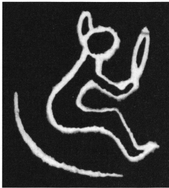
Indianisches Zeichen: Der Mann, der Macht besitzt.

Im Dezember 1773 brach zwischen den Kolonisten und der britischen Herrschaft ein offener Konflikt und damit der Krieg aus. Am 4. Juli 1776 erklärten die Verei-