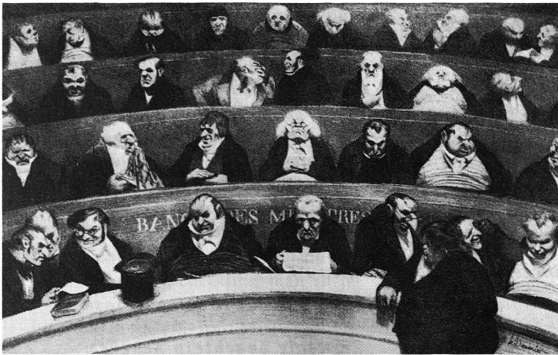
Honoré Daumier: «Der gesetzgebende Bauch», Lithographie, 1834. Musée d'Orsay, Paris.

nicht-Mitglieder in Mittel- und Osteuropa einbeziehen, was wir meines Erachtens unbedingt tun sollten, sieht die Situation bezüglich Konvergenz noch prekärer aus. Die im Vertrag von Maastricht verlangten Anpassungen sind zwar durchaus begrüssenswerte Korrekturen früherer Versäumnisse. Je grösser diese aber waren, desto schmerzhafter werden die Folgen sein.