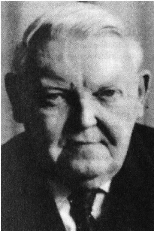
Ludwig Erhard (1897–1977).

Umstand, dass zum Beispiel im Bonner Wirtschaftsministerium die Bilder John Maynard Keynes und Walter Euckens nebeneinander gezeigt werden, wirkt so wenig überzeugend wie die Ahnenreihe der Wirtschaftsminister von Victor Agartz bis zu Ludwig Erhard . Was ich damit sagen möchte ist, dass man nicht Ungleichnamiges – auch nicht als blosser Schau – miteinander verbinden kann.