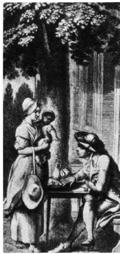
Gertrud sucht den Landvogt Arner auf. Kupferstich von D. Chodowiecki aus einer französischen Ausgabe von «Lienhard und Gertrud», 1783.

Als Pestalozzi diese Schrift verfasste, lag der erste grosse Misserfolg seines Lebens schon hinter ihm. Er hatte jung und unerfahren als Landwirt begonnen; das Resultat war dementsprechend, von Rendite keine Rede. So wählte er den Ausweg, das Schwergewicht seiner Aktivität auf die hauseigene Textilmanufaktur zu verlegen, mit dem Neuhof als Zentrum und Kindern als Arbeitskräfte. Diesmal konnte die totale Katastrophe mit Konkurs nur dank schwiegereltherlicher Intervention abgewendet werden. Der mangelnde Sinn für Realitäten und für das Geld war damit