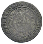
Av. 7 / Rv. 7

R. Kunzmann: Die Halbbatzen von Obwalden – eine Stempel- untersuchung, SM 71, 2021, S. 20–25.