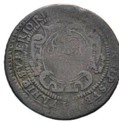
Av. 16 / Rv. 14