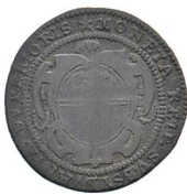
Av. 14 / Rv. 13