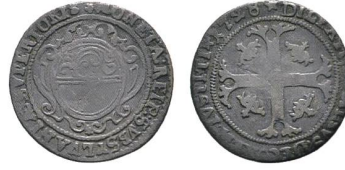
Av. 8 / Rv. 20

Es versteht sich von selbst, dass die Obwaldner Halbbatzen mit Jahreszahl 1726 weitaus am häufigsten vorkommen müssen, was auch der Fall ist. Es ist für Spezi­alsammler von Obwaldner Münzen bereits die Ausnahme, einen Halbbatzen 1727 zu entdecken, und noch seltener findet er ein Exemplar mit der Jahreszahl 1728.