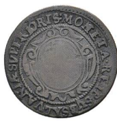
Av. 18 / Rv. 15