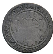
Av. 2 / Rv. 17