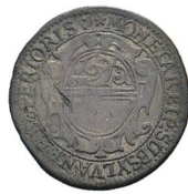
Av. 9 / Rv. 3