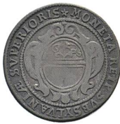
Av. 12 / Rv. 4