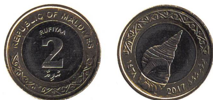
Abb. 3: Eine 2 Rufiyaa-Umlaufmünze aus den Malediven mit einer richtiggewundenen Charonia tritonis -Schale auf dem Revers, Ø 25,5 mm.

Eine seitenverkehrte Wiedergabe von Schneckenschalen tritt oftmals dort auf, wo bei der Bildentstehung die Schneckenschale zuerst auf einem als Matrize dienenden Medium dargestellt werden muss und das eigentliche Bild als seitenverkehrter Abdruck dieser Matrize entsteht. Dies trifft auf diverse Bildmedien zu. So kennt man z. B. eine seitenverkehrte Marmor-Kegelschnecke ( Conus marmoreus ) zeigende Radierung Rembrandts. Ein Kupferstich aus James Cooks Bericht zu seiner zweiten Südseereise zeigt die seitenverkehrte Schale einer Charonia , die mit einem Mundstück versehen als Schnecken trompete dient 10 . Minoische Siegelabdrücke, die im Palast von Phaistos (Kreta) gefunden wurden, weisen ebenfalls seitenverkehrte Schalen einer Charonia auf 11 .