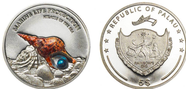
Abb. 1: Gedenkmünze aus Palau mit einem falschgewundenen Tritonshorn ( Charonia tritonis ) auf dem Revers, Ø 38,61 mm. (Photos: CIT Coin Invest AG).

Die Mollusken (Weichtiere) bilden schon seit der Antike ein sehr beliebtes Münzmotiv. Von den insgesamt acht existierenden Molluskenklassen wurden und werden die Kopffüssler (Cephalopoda), Muscheln (Bivalvia) und Schnecken (Gastropoda) auf Münzen gezeigt 2 . Bei den Schnecken und Muscheln werden allerdings fast immer nur die Schalen (Conchylien) und nicht der Weichkörper dargestellt. Der mikronesische Inselstaat Palau hat nun im Rahmen einer unter dem Motto «Marine Life Protection» laufenden Serie eine «Pearls of the Sea» betitelte Subserie von silbernen Gedenkmünzen ausgegeben, auf denen jeweils eine farbige Muschel- oder Schneckenschale 3 in Verbund mit einer echten Perle gezeigt wird 4 . Bei einer 2016 in einer Auflage von 2500 Stück emittierten Münze aus dieser Serie, die ein Tritonshorn ( Charonia tritonis ) zeigt (Abb. 1), ist jedoch aus malakologischer 5 Sicht ein Fehler unterlaufen, der in diesem kurzen Beitrag aufgezeigt und diskutiert werden soll.