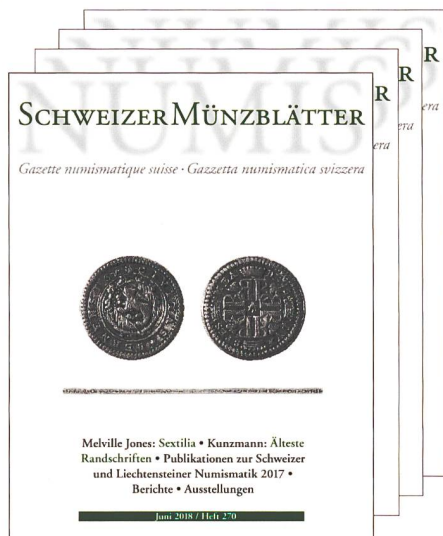
Gazette numismatique suisse