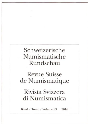
Revue Suisse de Numismatique