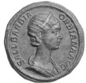
Sallustia Barbia Orbiana, sestertius de bronze

TRADART GENEVE SA 1, rue du Perron - 1204 Genève Tel +41 22 817 37 47 - Fax +41 22 817 37 48 e-mail : numismatique@tradart.ch site : www.tradart.ch