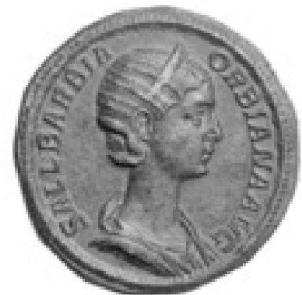
Salustiana Barbara Orliana, secessore de bronze

TRADART GENEVE SA 1, rue du Perron - 1204 Genève Tel +41 22 817 37 47 - Fax +41 22 817 37 48 e-mail : numismatique@tradart.ch site : www.tradart.ch