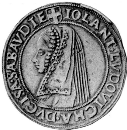
Violante Ludovica von Savoyen, 4 Testons

Dem eigentlichen Schauraum vorgelagert ist ein Saal, der dem Goldschmiedehandwerk gewidmet ist. Es finden sich zudem Kostproben aus der reichen Medaillen- und Plaketensammlung. Eingestimmt auf das eigentliche Münzkabinett wird man hier auch durch die Präsentation der zwei Sammlungen, die den eigentlichen Grundstock des Museums und der Münzensammlung bilden: das Amerbachsche Kunst- und Raritätenkabinet und das «Museum» Faesch, gebildet im 16.