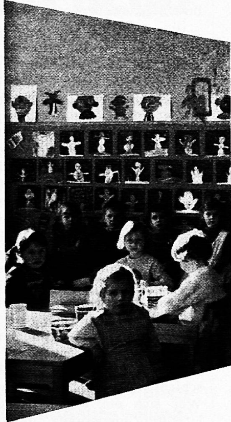
Mobiliar für Kindergärten

mit der 10-Jahres-Garantie für dauerhaften Schreibbelag und den Vorteilen: Angenehmes, weiches, blendungsfreies Schreiben und Zeichnen auf graugrün und schattenschwarzen, magnethaftenden und kratzfesten Flächen, die leicht zu reinigen sind.